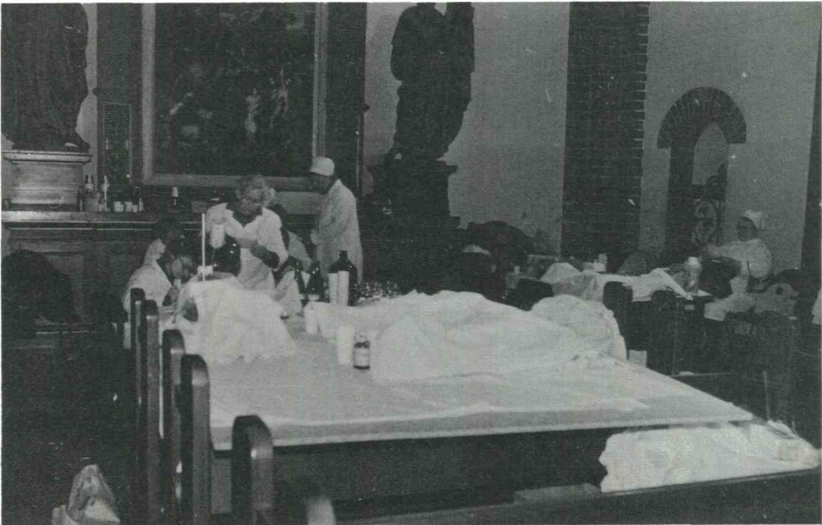
En kyrka har förvandlats till provisoriskt sjukhus i Riga.