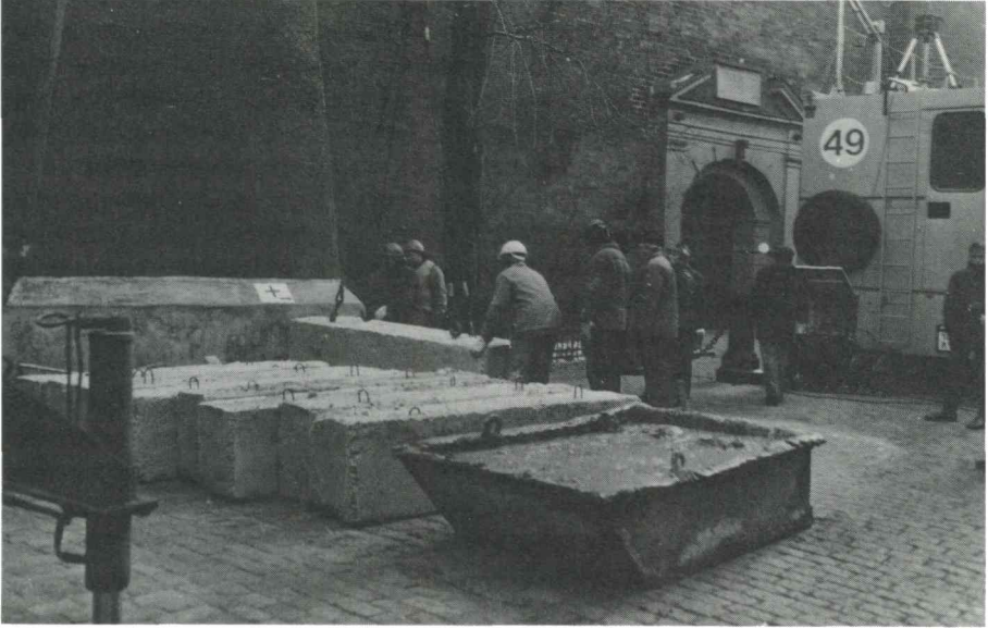
Barrikader av betongblock lyfts på plats vid en kyrka i Rigas Gamla Stad.