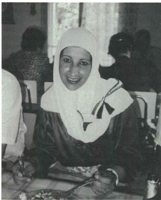
Palestinsk kvinna, som sattes i fängelse på grund av färgen på tofsarna på huvudduken.

Intifadan var ingen kontrollerad aktion, utan uppstod spontant. Utvecklingen har varit svårt att kontrollera. Våld har använts i betydande utsträckning. Bland palestinierna finns många interna motsättningar och fraktioner som bekämpar varandra. Många våldshandlingar hade egentligen inte med intifadan att göra. Bl a likviderades hundratals påstådda samarbetsmän utan prövning, i vissa fall troligen som rent personlig hämnd. Gamla släktfejder drevs vidare under intifadans täckmantel. Vissa ungdomsgrupper utvecklades mer till kriminella gäng.