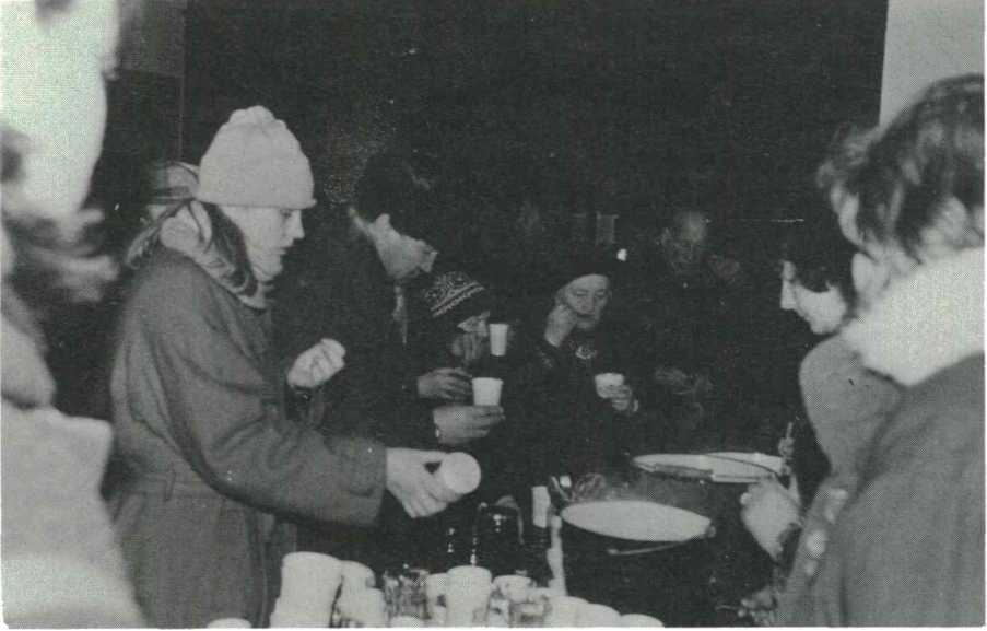
Utspisning av demonstranter i januarikylan i Riga.