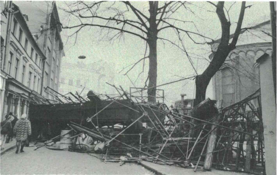
Barrikader av bråte och lastbilssläp i Riga.