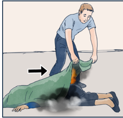
عندما تحترق ملابس شخص ما: حاول أن تمدد الشخص على بطنه. قم بإخماد النار بواسطة بطانية الحريق أو ما شابه ذلك. ابدأ بالإطفاء من الرأس واستمر في النزول.