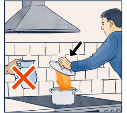
عندما تشتعل النار في الطنجرة أو المقلّة: ضع غطاء أو بطانية الحريق عليها لإخماد النار. لا تستخدم الماء مطلقاً عندما يحترق الموقد. الماء يتسبب في انتشار التيران.