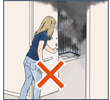
إذا شبَّ حريق في مكان آخر من المبنى وكان هناك دخان في بيت الدرج، فيجب عليك البقاء في شقتك.