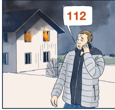
اتصل بالرقم ١١٢ وأبلغ عن الحريق. أخبرهم بما حدث، وفيما إذا كان هناك أي شخص مصاب، وأين تحتاج المساعدة وهم يتعين عليك أن تتصل.