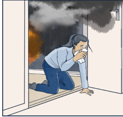
إذا لم تتمكن من إطفاء النار بنفسك بدون أن تعرّض نفسك للخطر، فيجب عليك الخروج من الشقة.