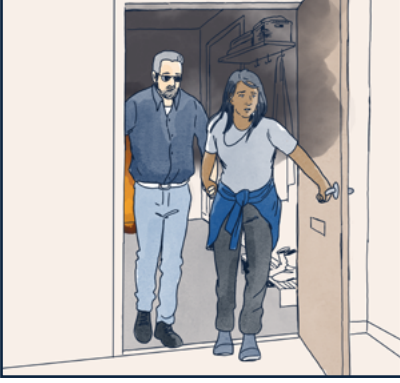
قم بإنقاذ الآخرين دون تعريض نفسك للخطر

في بعض الأحيان قد يكون من الأفضل القيام بما هو مطلوب بترتيب مختلف. إذا كنتم اشخاص عديدون، فيمكنكم ان تتساعدوا معًا.