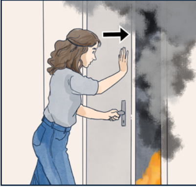
أغلق باب الغرفة التي شبَّ فيها الحريق.