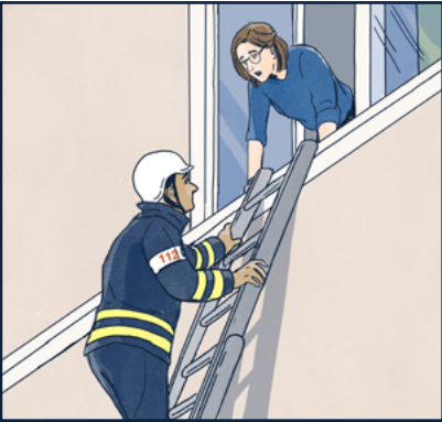
سوف تساعدك خدمة الإنقاذ إذا كنت بحاجة إلى الخروج.

باب الشقة يوقف الحريق في حوالي ٣٠ دقيقة. لا تخرج أبداً إلى الدرج إذا كان مليئاً بالدخان. لا تستخدم المصعد عندما يكون هناك حريق.