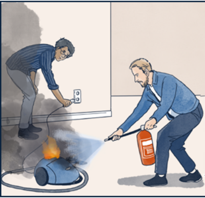
عند نشوب حريق في الأجهزة الكهربائية: قم أولاً بفصل القابس من الجدار. قم بإخماد النار ببطانية الحريق أو الماء. اذا قمت باستخدام طفاية الحريق البودرة، فيمكنك إطفاء الحريق فوراً دون سحب القابس.