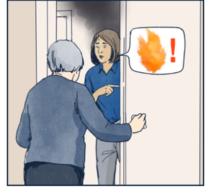
قم بتحذير الأشخاص الآخرين الذين يمكن ان يكونوا معرضين للخطر.