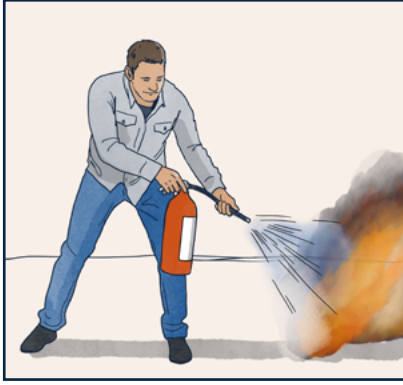
اطفأ النار اذا كنت تعتقد أن بإمكانك ان تفعل ذلك بدون أن تعرّض نفسك الى الخطر.