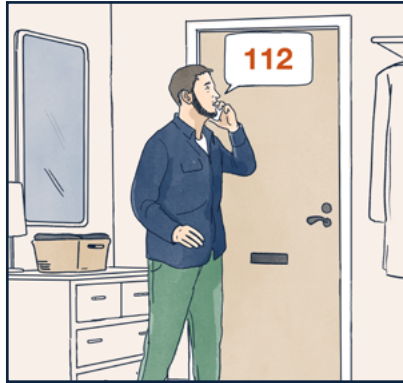
احرص على ان يبقى باب الشقة مغلقاً. اتصل بالرقم ١١٢ وأبلغ عن الحريق.