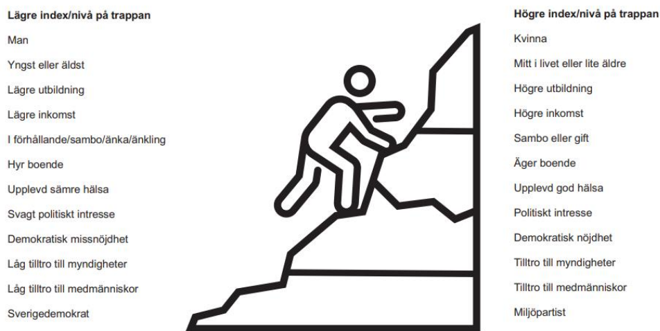
Figur 2 Sammanfattande illustration av faktorer som leder till jämförelsevis högre respektive lägre index/nivå på trappan för hemberedskapsengagemang, 2023

Kommentar: Sammanfattande illustration av slutsatser rörande högre eller lägre nivåer av index och steg som redovisas i tabell 3 och tabell 4. Samband som presenteras på detta översiktliga vis skiljer sig åt i styrka.