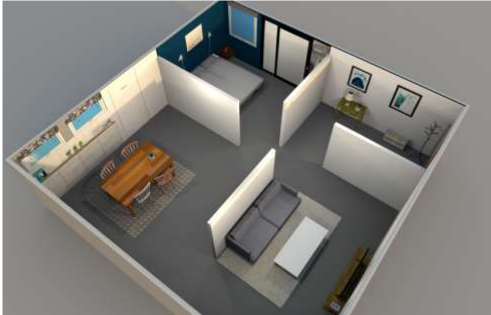
Översikt över den lägenhetsmiljö som skapats i RCR Simulation Lab. Forskningsdeltagarnas aktivitet spelades in med hjälp av kameror och mikrofoner i taket.