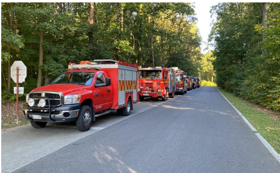
Flera svenska räddningstjänster donerade fordon till Ukraina. Dessa kördes till EU:s logistiknod i Skladnica Niemce i Polen för vidare leverans till räddningstjänsten i Ukraina.

Förfrågningarna på materiel från Ukraina har varit av mycket varierande karaktär och MSB har haft ett fokus på att tillgodose materiel som kan anses vara direkt eller indirekt livräddande. Detta har bidragit till att de ukrainska myndigheterna och andra efterfrågande organisationer har fått en utökad kapacitet och resurser att bistå de krigsdrabbade samhällena och befolkningen.