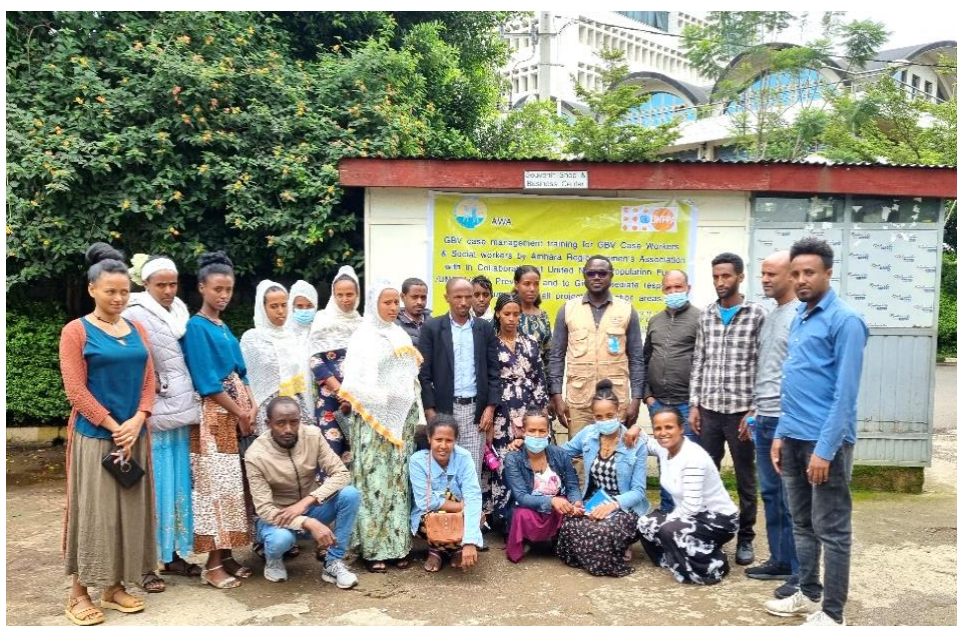
Deltagare från Amhara Women Association i Bahir Dar, Amhara-regionen i Etiopien, som genomförde en utbildning i bemötande av personer utsatta för könsbaserat våld.

Insatsen har även fokuserat på att stärka uppföljningen av UNFPA:s program. Insamlad information har använts som underlag för beslut om förbättringar rörande partnerskap, behovsanpassning, resursallokering och prioritering av aktiviteter och har därigenom bidragit till en förbättrad respons. Uppföljning har bland annat visat brister i kapacitet hos en partner, som även efter coachande insatser uppvisat brist på aktivitet och engagemang och vars samarbetsavtal följaktligen sagts upp.