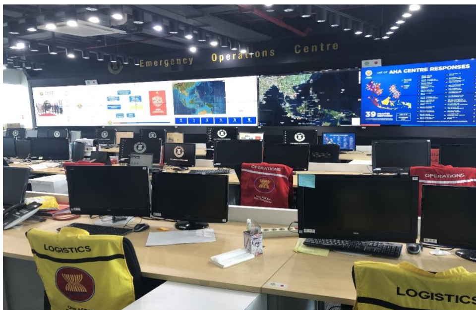
AHA-centrets lednings- och sambandscentral i Jakarta, Indonesien, med plats för ett 50-tal personer. Bilden är tagen innan en utbildning för centrets personal.