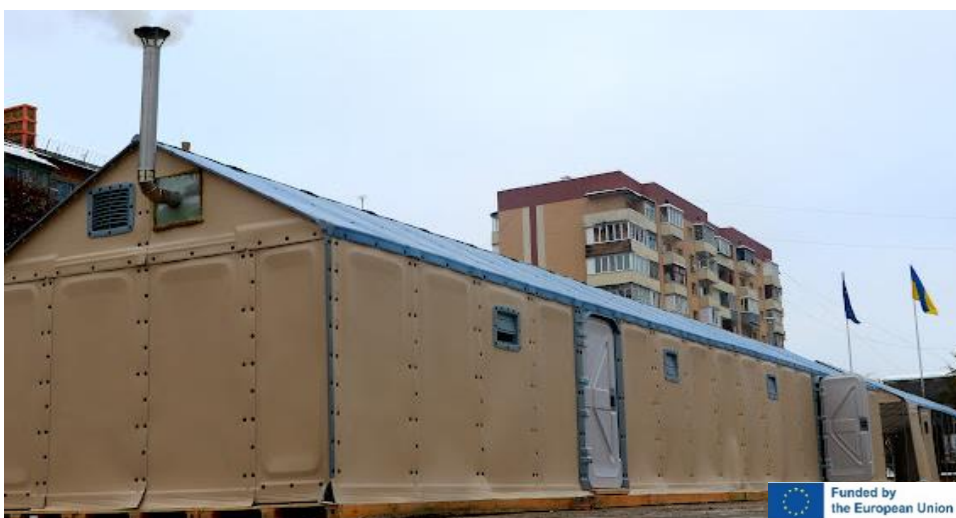
MSB upprättade temporära nödbostäder i Bucha. Husen på bilden används som samlingsplats och värmestugor för lokalbefolkningen.

MSB har även stöttat Bucha military administration och Bucha City council med 250 respektive 300 tillfälliga nödbostäder som ska nyttjas för befolkningen som flyr kriget. Dessa tillfälliga nödbostäder innefattar boendemöjligheter, värme, och belysning för upp till 2 750 personer.