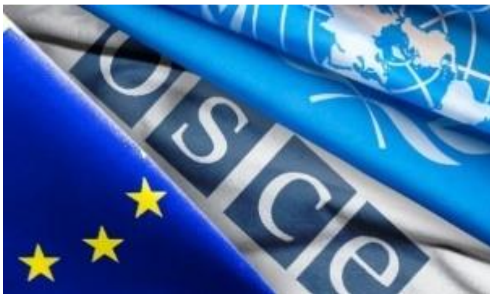
EU:s, OSSE:s och FN:s flaggor – MSB:s tre samarbetspartners inom ramen för fredsfrämjande insatser.

Utöver de utmaningar som klimatförändringarna medför för mänsklig säkerhet kan vi se hur konflikter får konsekvenser av klimatförändringar och vice versa. MSB har under året bidragit med miljörådgivare till EU:s civila krishanteringsinsatser i CAR och Somalia, samt kontinuerligt stöttat andra experter i deras tjänster att arbeta med miljö, klimat och säkerhet. Den miljörådgivarutbildning som genomfördes under våren var riktad att rusta framtida experter i EU:s civila krishanteringsinsatser. Mot bakgrund av detta deltog myndigheten i paneldiskussionen om miljö och den civila pakten i Stockholm Forum on Peace and Development 9 .