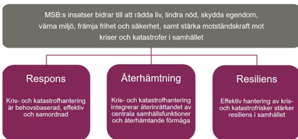
Figur 1. MSB:s resultatramverk för insatsverksamheten

MSB:s insatsverksamhet präglas av resultatstyrning, där ett samlat resultatramverk ligger till grund för planering, genomförande och uppföljning av den operativa verksamheten. Resultatramverket utgår från ett övergripande mål samt tre effektområden; respons, återhämtning och resiliens .