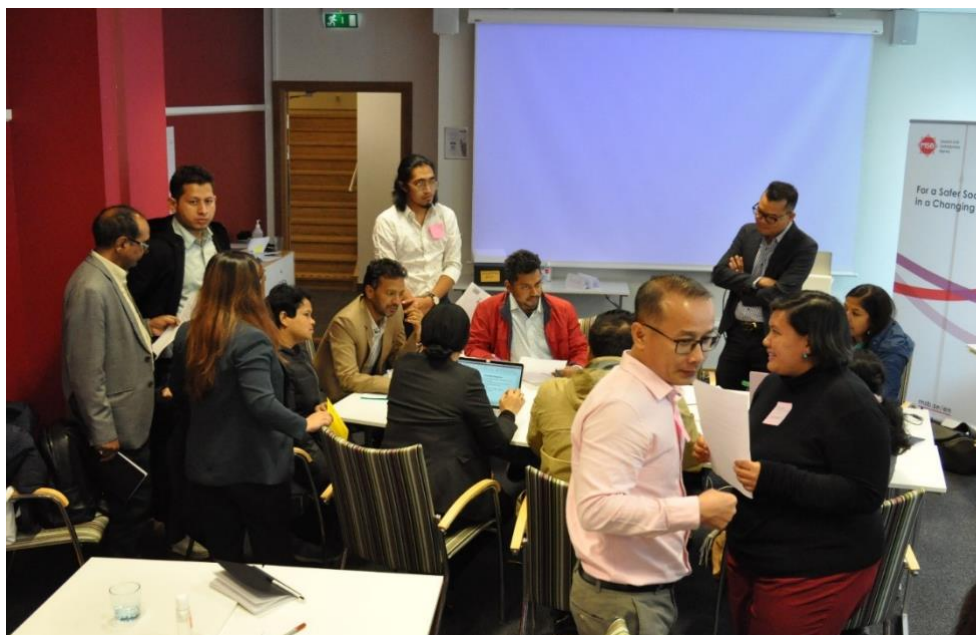
Deltagare från programmet International Training Programme in Disaster Risk Management (ITP DRM) deltar i en simuleringsövning under programmets Sverigebaserade utbildningsfas.

MSB:s internationella utbildningsprogram inom katastrofriskhantering, International Training Program for Disaster Risk Management (ITP DRM) , inkluderar komponenter kopplade till hela krishanteringsförloppet – från beredskap till respons och återuppbyggnad. Syftet är att stärka de deltagande organisationernas krishanteringsförmåga genom utbildning och mentorskap, liksom att främja nationell och regional samverkan. Under 2022 har programmets andra och tredje programcykler avslutats, och den fjärde programcykeln påbörjats. Deltagarna kommer från myndigheter, civilsamhället, universitet och den privata sektorn i Bangladesh, Nepal, Kambodja och Filippinerna.