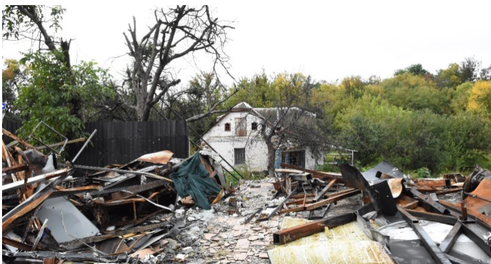
Under MSB:s uppföljningsresa i maj 2022 kunde man tydligt se förödelsen, både i städer och landsbygd. Här syns en bostad som har träffats under ryska attacker utanför Kiev.

Uppdraget omfattade så kallade nödbostäder men även annan relaterad utrustning, så som sängar, madrasser, kuddar, filtar, lakan, viss belysning samt elkablage. Utöver detta kompletterades uppdraget med att även upprätta en kapacitet för att kunna vinterisolera dessa nödbostäder samt att etablera en större sängreserv på 50 000 sängar för människor som flyr.