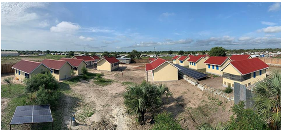
MSB:s anläggning i Leer i Sydsudan färdigställdes under 2022. Anläggningen möjliggör för humanitära aktörer att säkert verka på en annars väldigt otillgänglig plats och innefattar boende och kontorsplatser för 20 personer. Anläggningen är byggd av lokala material och i hög grad självförsörjande på el.

till detta är bland annat svåra logistiska förutsättningar, utmaningar i samarbetet med projekttagaren samt förseningar och fördröjningar hänförliga till pandemiutbrottet.