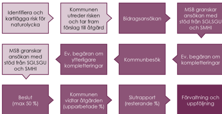
Figur 3. Ansökningsprocessen.