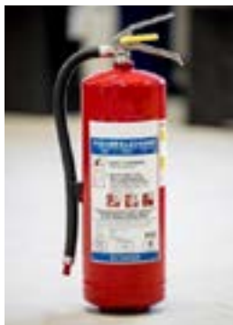
Handbrandsläckare, pulver 6 kg.

När man förvarar brandfarlig gas måste man ha släckutrustning i syfte att kunna släcka en brand i omgivningen och därmed förhindra att branden sprider sig till eller orsakar skadlig uppvärmning av gasflaskorna.