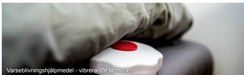
Varseblivningshjälpmedel - vibrerande larmdon