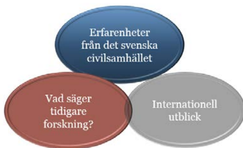
Figur 1. Projektets tre delstudier.

Forskningsprojektet Civilsamhällets respons på olyckor och kriser – bistånd eller motstånd? består av tre delstudier och resultaten redovisas i denna rapport.