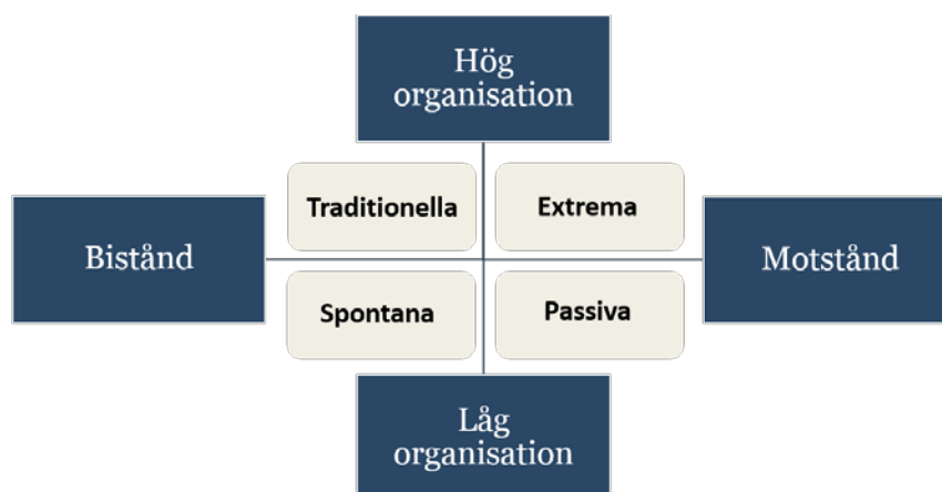
Figur 2. Tolkningsram för att förstå drivkrafter och former av organisering.

För att förstå drivkrafter och former av organisering har en tolkningsram (figur 2) arbetats fram. Forskningsintervjuerna som genomförts har kretsat kring frågor som exempelvis; vad säger frivilligorganisationerna själva om drivkrafter och olika sätt att organisera sig på? Finns det spänningar i arbetet?