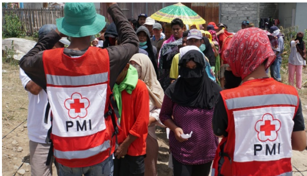
Bild 1. Palang Merah Indonesia (Indonesiska Röda Korset) har över två miljoner volontärer.

Indonesien har en befolkning på över 260 miljoner invånare och landet består av 17 000 öar och är indelad i 34 provinser. Utifrån ett katastrofberedskapsperspektiv finns det därför många utmaningar, inte minst logistiskt och resursmässigt. Enligt Indonesiska Röda Korset övervakas och hanteras omkring 2 500 krissituationer och katastrofer (av varierad storlek) varje år. Givet omfattningen är det inte förvånande att frivilliga resurser utgör en viktig och också många gånger integrerad del i landets krisberedskapssystem.