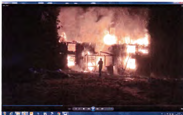
Bild 4 visar bild tagen från film av [redacted]. Första styrkan har kommit. Det är helt övertänt

Bild 3 visar bild tagen av [redacted] strax innan Räddningstjänsten anländer.