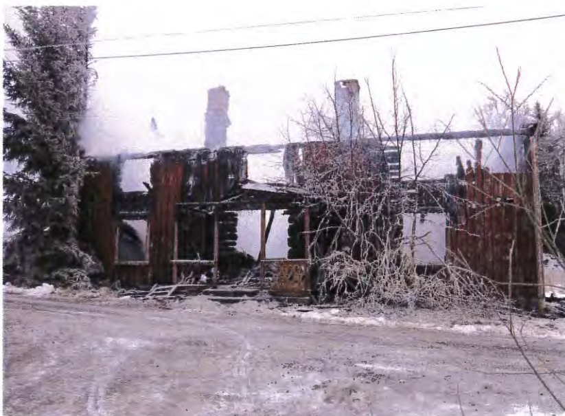
Bild 10 visar fastigheten dagen efter branden.

Väderleken var 22-23 minusgrader, snö på marken och vindstilla.