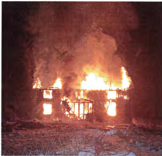
Bild 3 visar bild tagen av [redacted] strax innan Räddningstjänsten anländer.