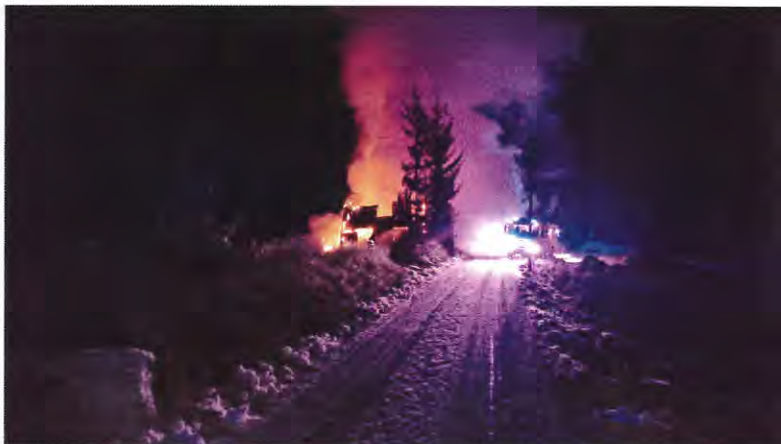
Bild 9 visar fastigheten, branden norrifrån.

Väderleken var 22-23 minusgrader, snö på marken och vindstilla.