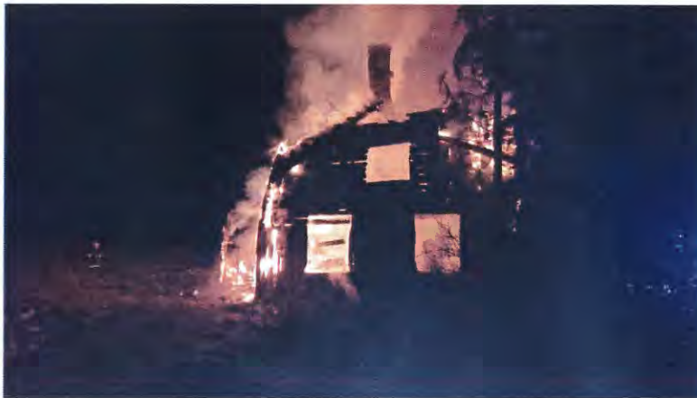
Bild 8 visar norrsidan på huset. Till vänster en liten utbyggd farstu.