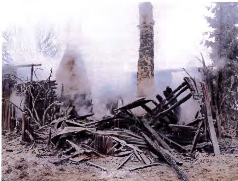
Bild 11 visar dagen efter branden, baksidan av fastigheten.

Utrymmet mellan skorstenarna var köket där mannen vistades, och återfanns.