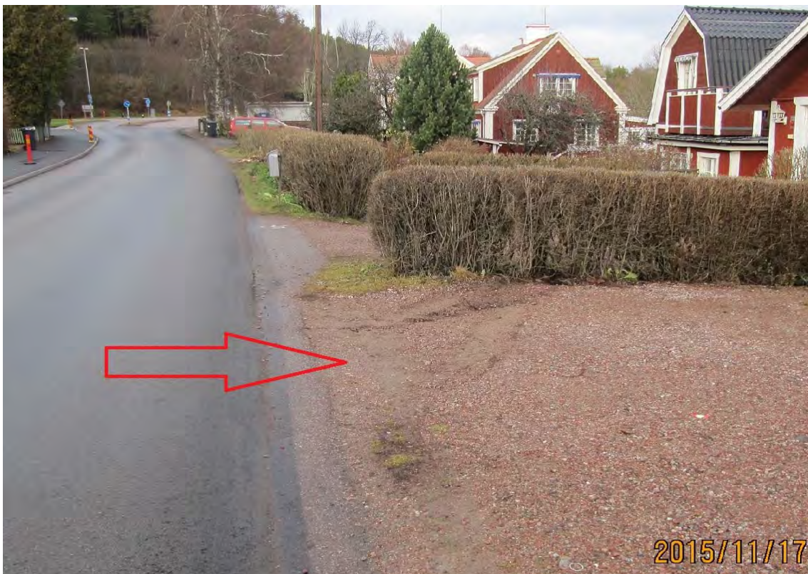
Bild 2: Här stod den första påkörda bilen. Spår i gruset där fordonet tryckts mot häcken.