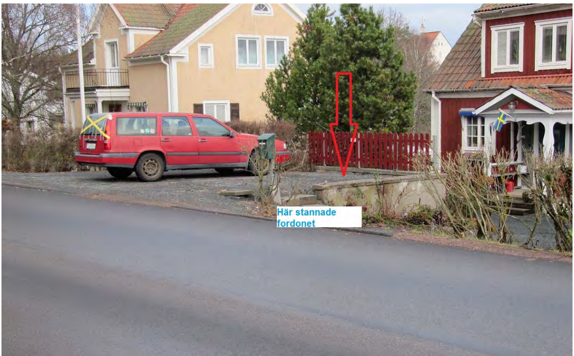
Bild 5: Här stannade fordonet. På andra sidan av bilen på bilden och häcken påträffades föraren.