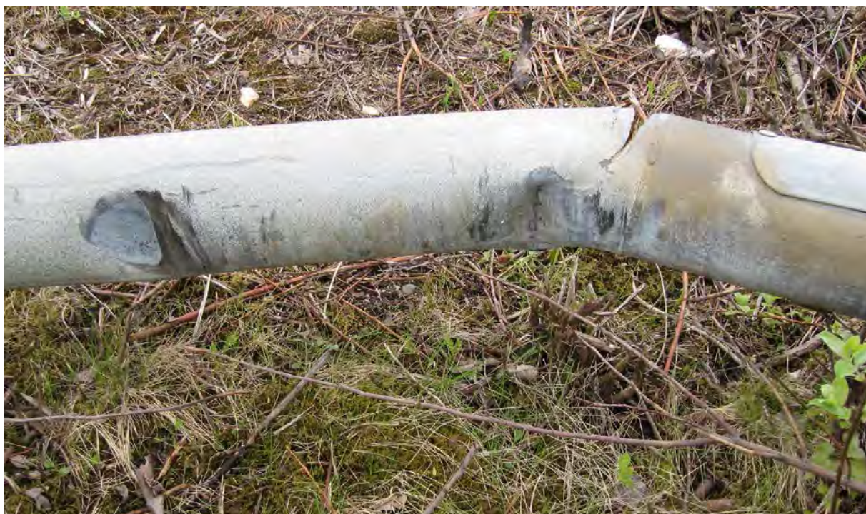
Bild5: Samma lyktstolpe visar märken efter bilen.