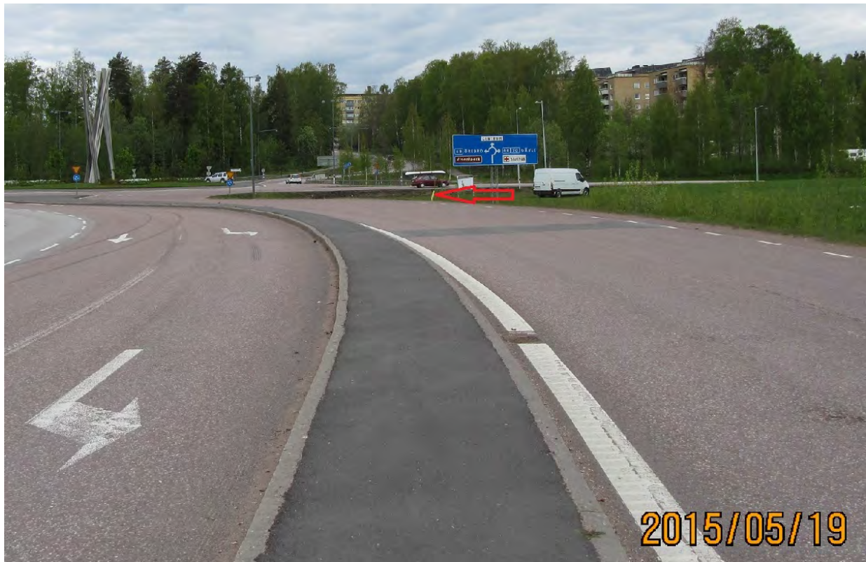
Bild 1: Vy av infarten till rondellen, pilen pekar på var den nerkörda lyktstolpen stod.