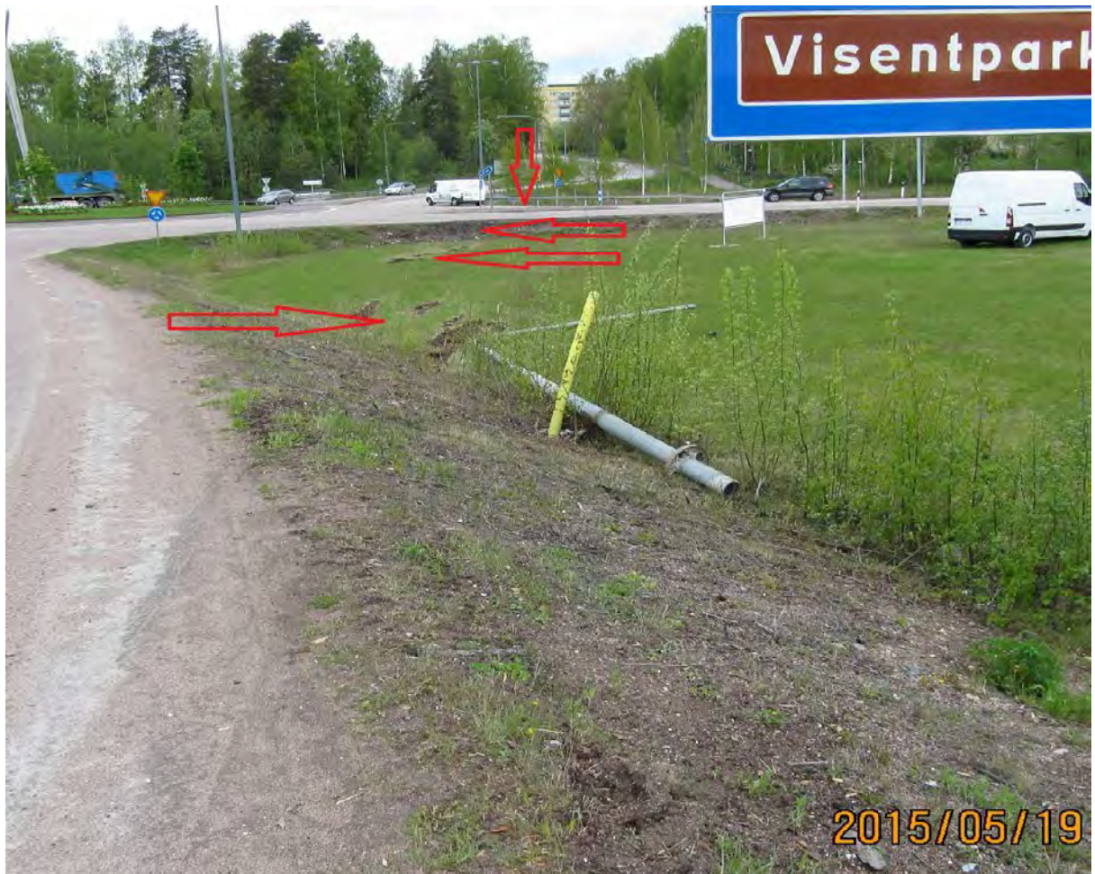
Bild 3: Pilarna visar islagsplatser och slutposition på olycksbilen.