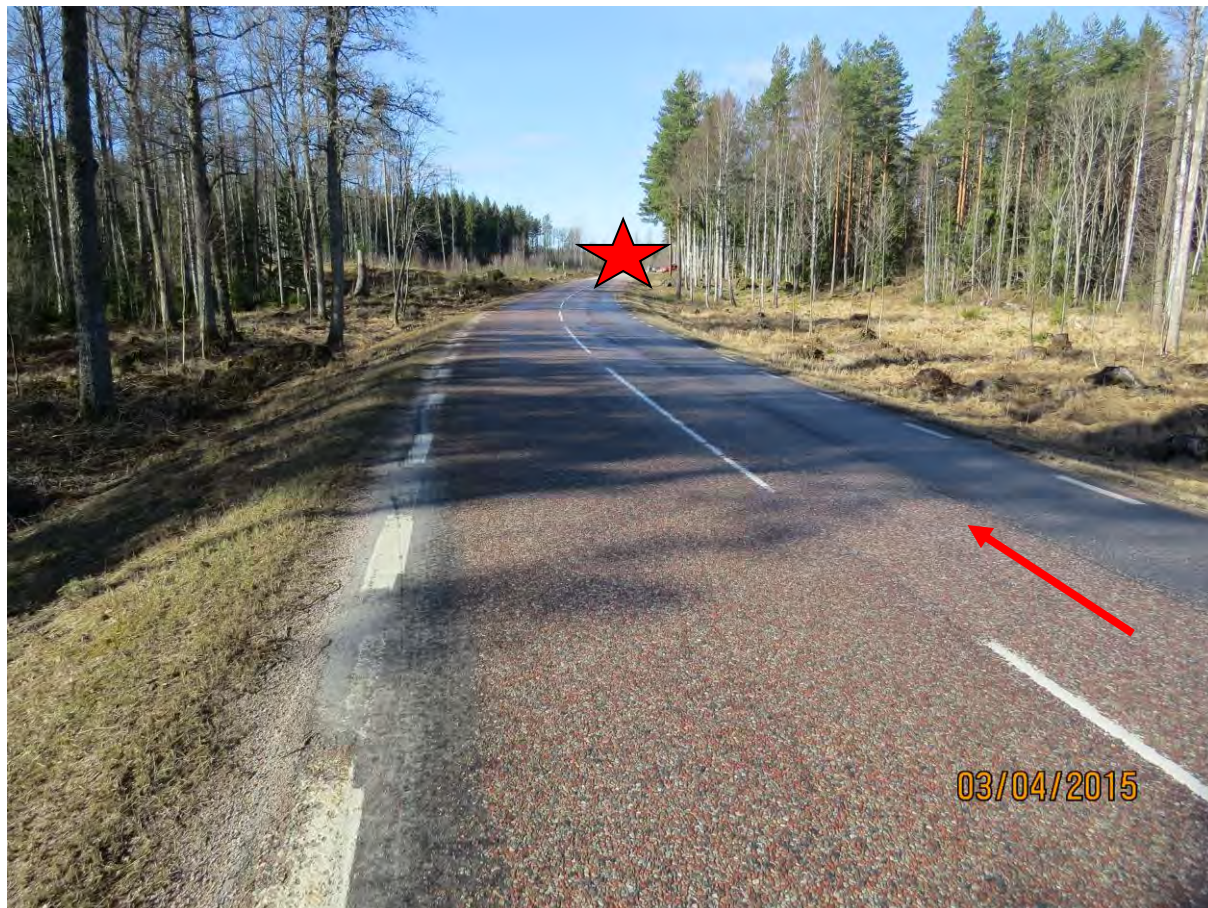
Bild 1: Den röda stjärnan anger olycksplatsen och pilen visar bilens färdriktning.

Olyckan skedde tidigt på morgonen och det rådde skymning men siktmöjligheterna var goda. Vägens beläggning är asfalt och det fanns inga hål eller ojämnheter i vägbanan. Vägbanan var fläckvis väldigt hal då det kvällen innan olyckan kommit regn och över natten blivit minusgrader. De vitmålade vägmarkeringarna var i mycket gott skick. Vägens bredd är ca 6 meter. Hastighetsbegränsningen på platsen var 80 km/h. Olycksplatsen ligger i en svag högerkurva (se bild 1).