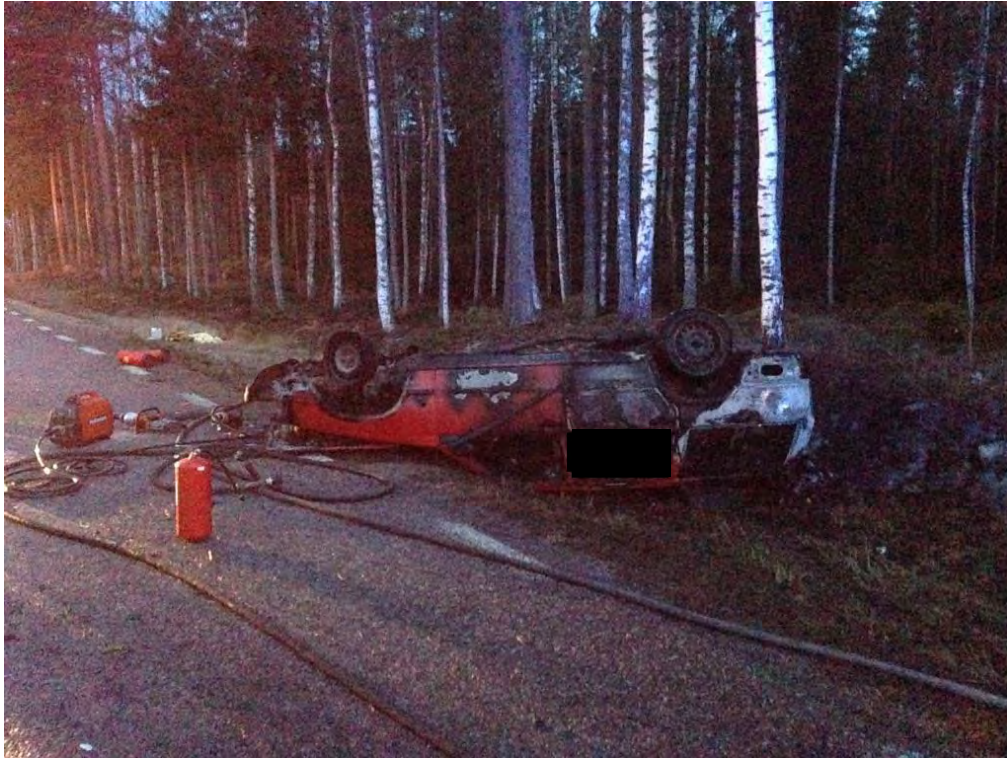
Bild 3: Fordonets läge efter att den har slagit runt och börjat att brinna.