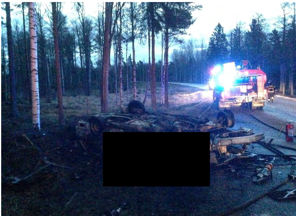
Bild4: Fordonets läge efter att den har slagit runt och börjat att brinna.