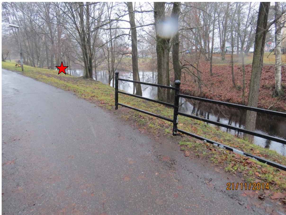
Bild 2: Röda stjärnan visar platsen där mannen faller ned i vattnet.

Mannen är ute och promenerar med sin hund strax efter klockan 21:00 och hamnar i vattnet.