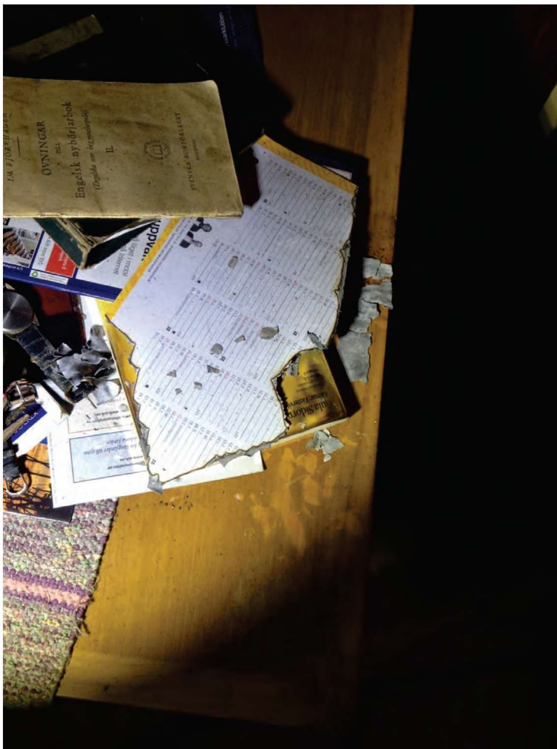
Bild 5. Bränd kalender på skrivbord i sovrummet.

När den aktuella branden uppstod klarade inte kvinnan av att agera själv. Vid hemtjänstens framkomst låg hon på soffan i köket, oförmögen att kunna släcka eller ta sig ut själv. Hade hon inte lyckats trycka på trygghetslarmet hade hon förmodligen legat kvar i röken en längre stund och därmed ådragit sig allvarliga skador eller, i värsta fall, omkommit.