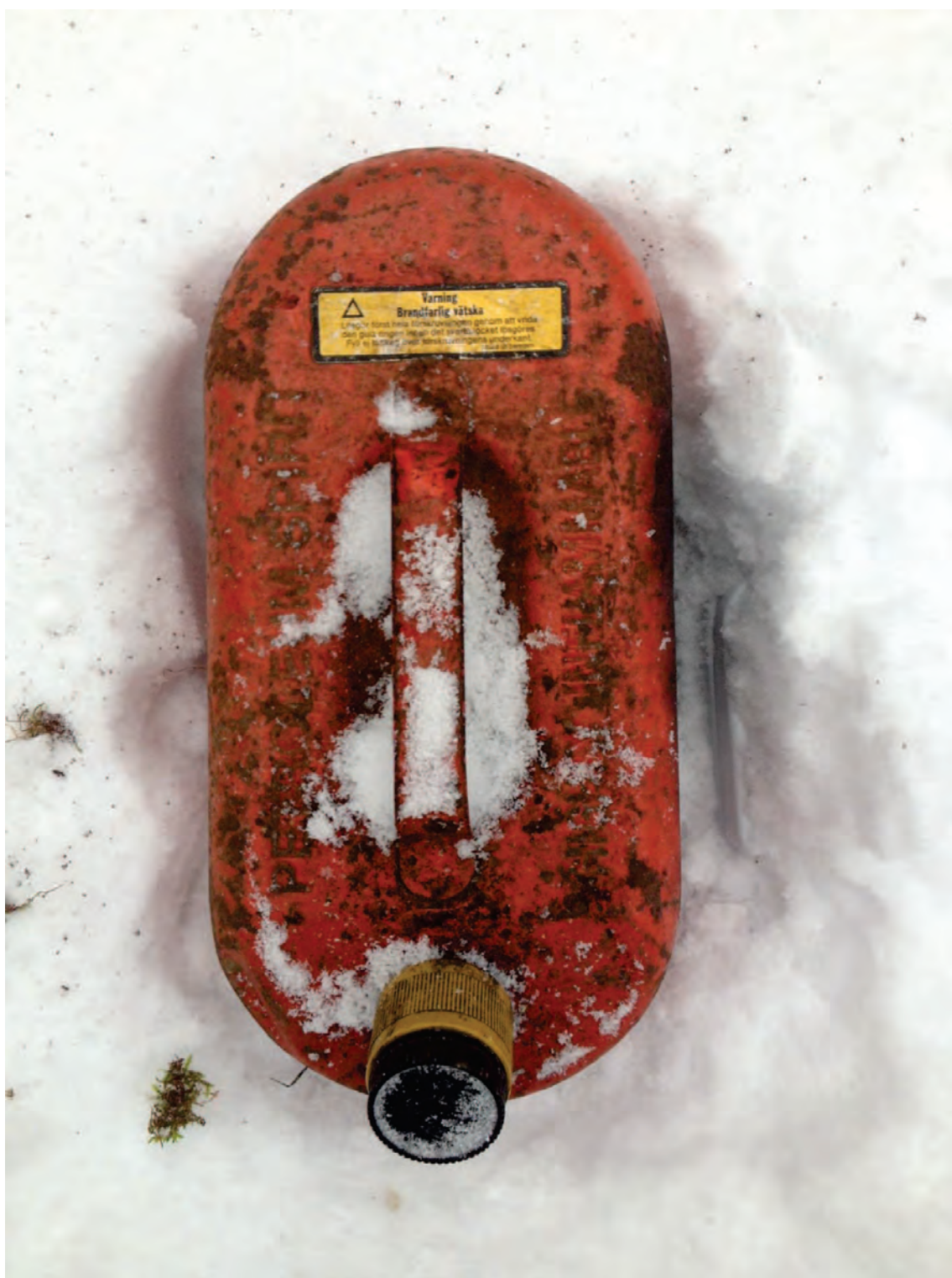
Bild 3. Bensindunken, som vid räddningstjänstens framkomst stod på golvet framför vedspisen.

En möjlig orsak till branden kan vara att kvinnan använt bensin för att tända vedträna och spillt ut lite på golvet, varpå branden startade. Denna teori styrks av att det inte var något på golvet som brunnit, utan branden har varit i själva golvet.