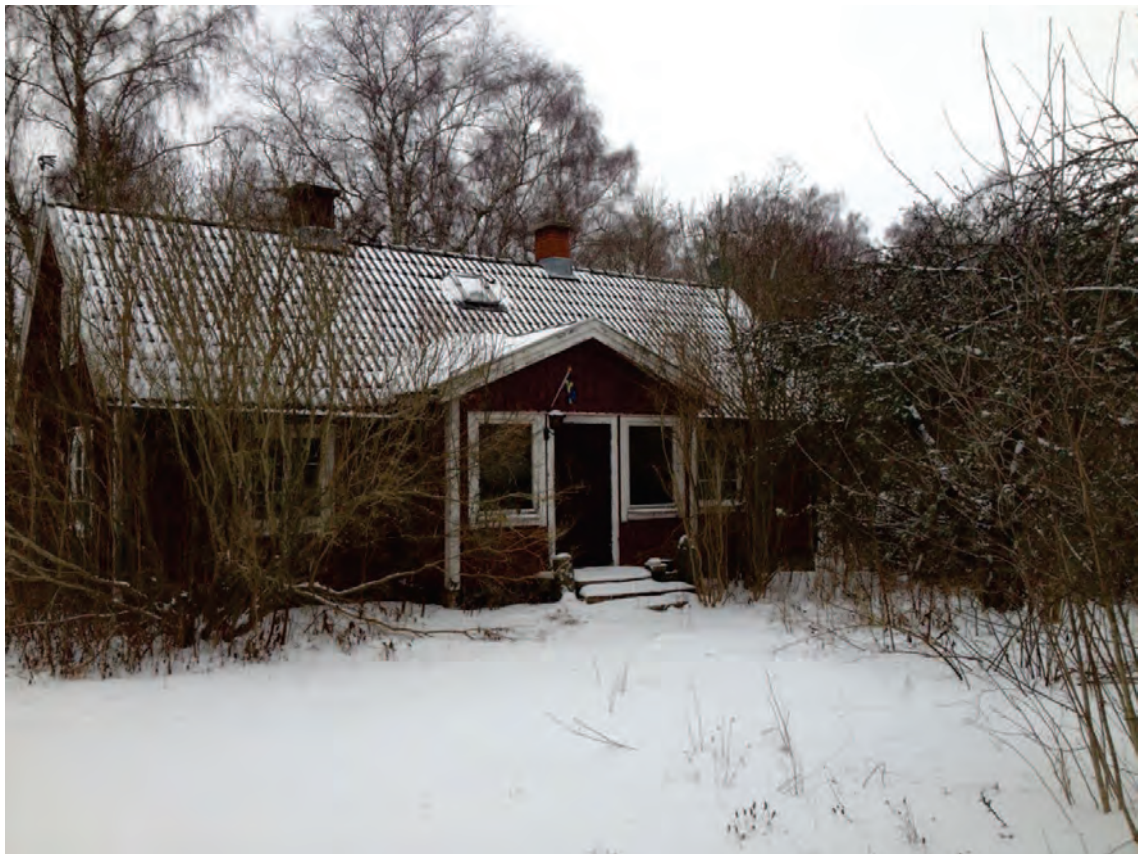
Bild 1. Det aktuella huset.