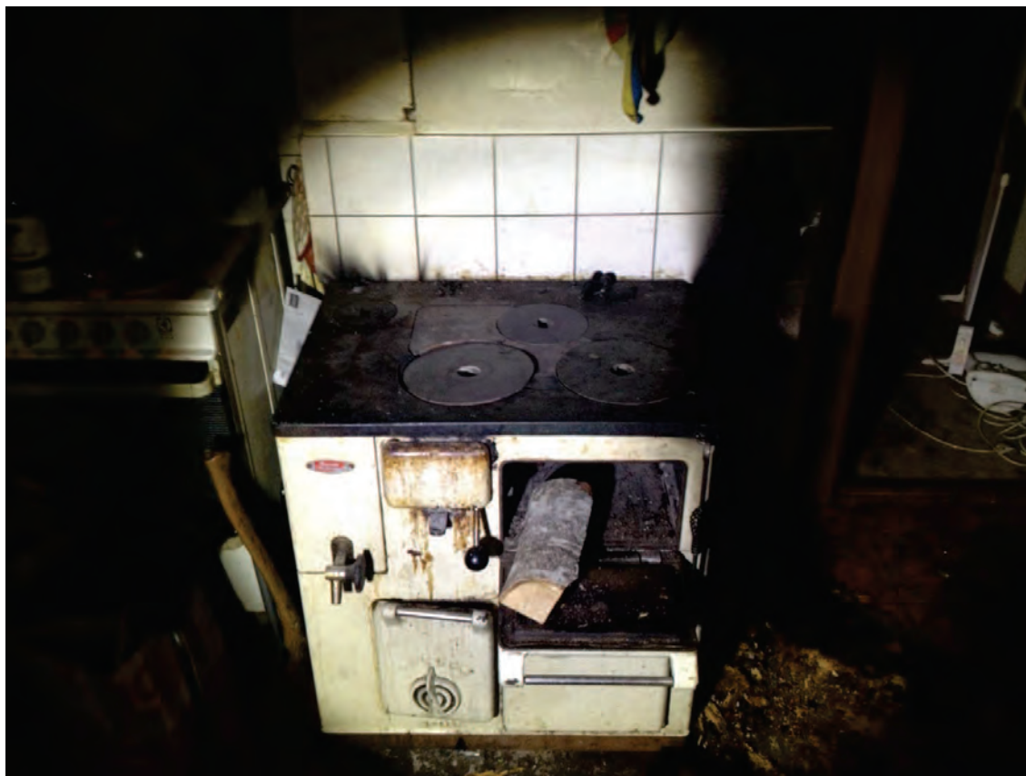
Bild 2. Vedspisen i köket.

Branden började i anslutning till en vedspis i köket, se bild 2 nedan.