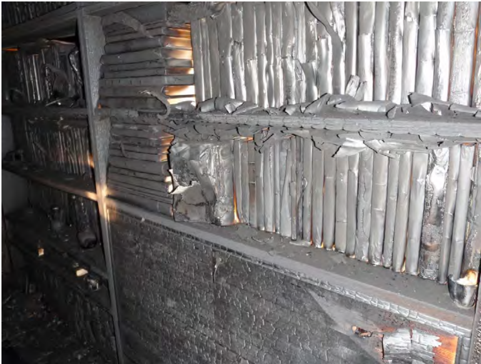
Bokhyllan ovanför startplatsen