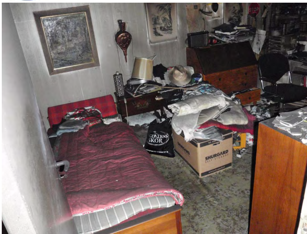
Gästrummet, 1:a dörren till höger innanför entrén