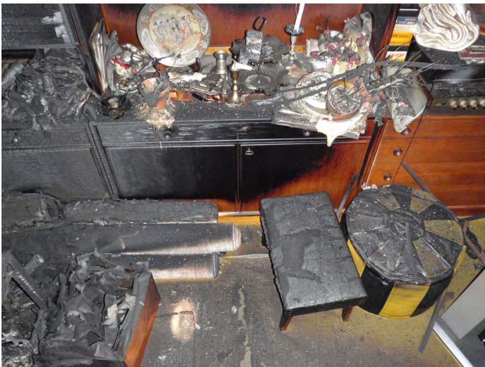
Brandbilden c:a 1,5 m till höger om startplatsen