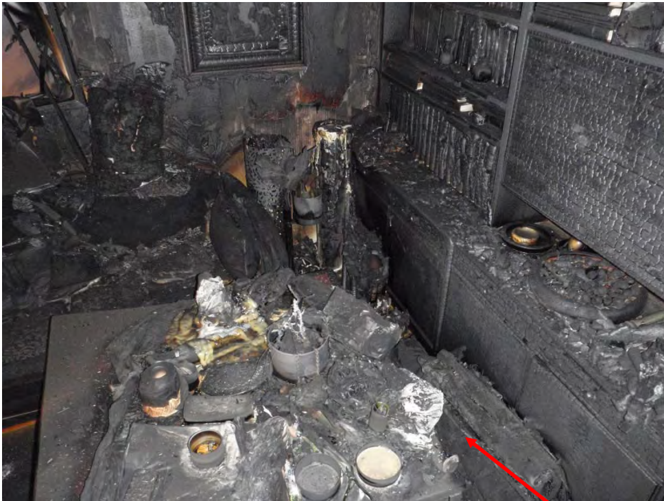
Soffans högra del, soffbord och bokhylla. Startplats.