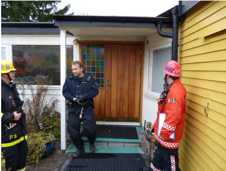
Entrén med köksfönster till vänster och gästrummets fönster med persienner till höger