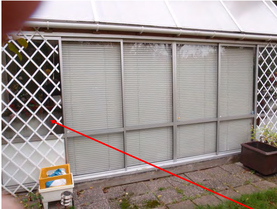
Uterummets utsida. Genom inglasningen kan man i dagsljus se sotskador på husets fasad runt fönstren.