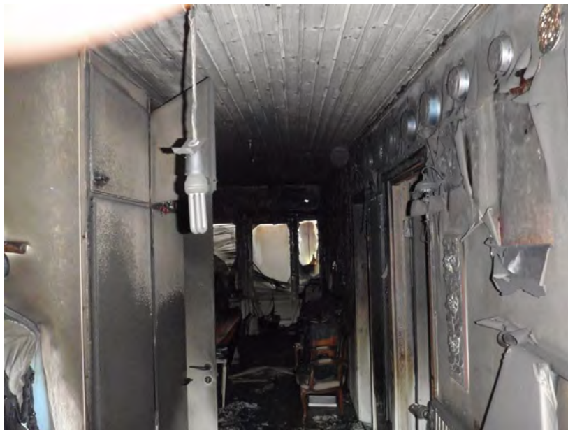
Hallen sedd från entrén med altandörren i bakgrunden