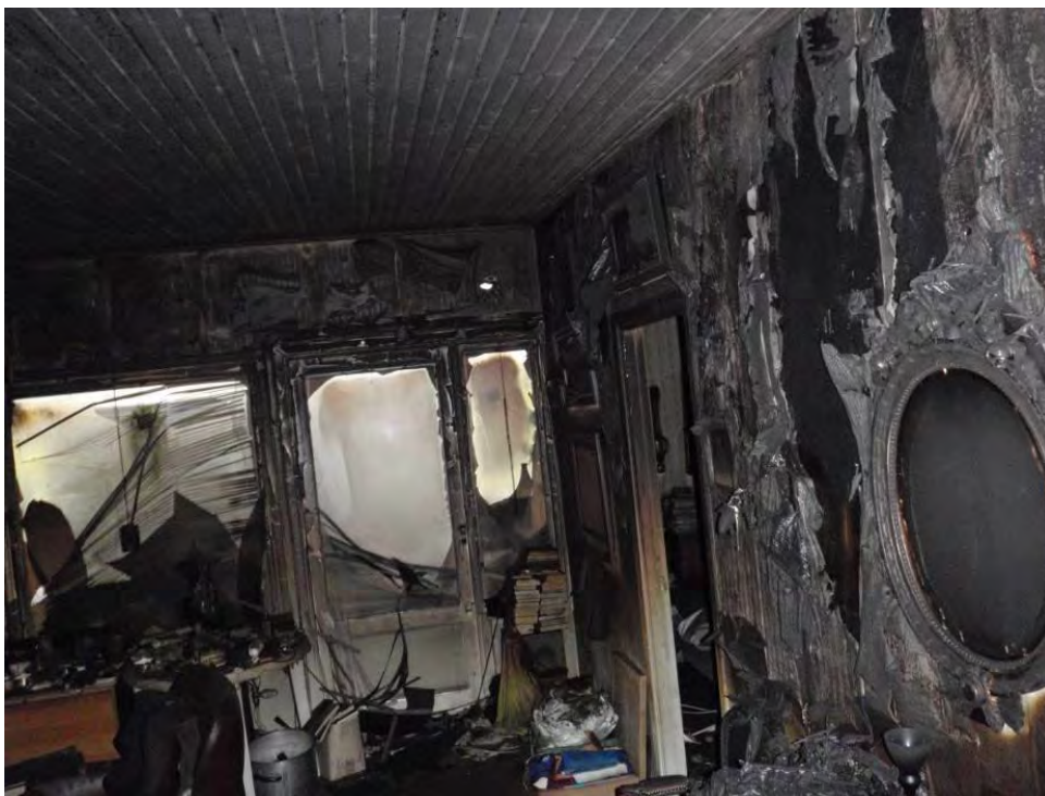
Vardagsrummets altandörr. Öppning mot sovrummet där makarna hittades till höger