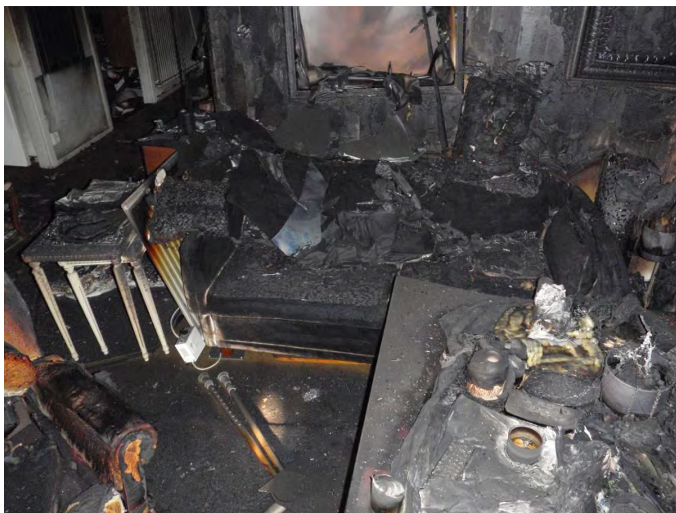
Soffans vänstra del och soffbord sedd med ryggen mot altan