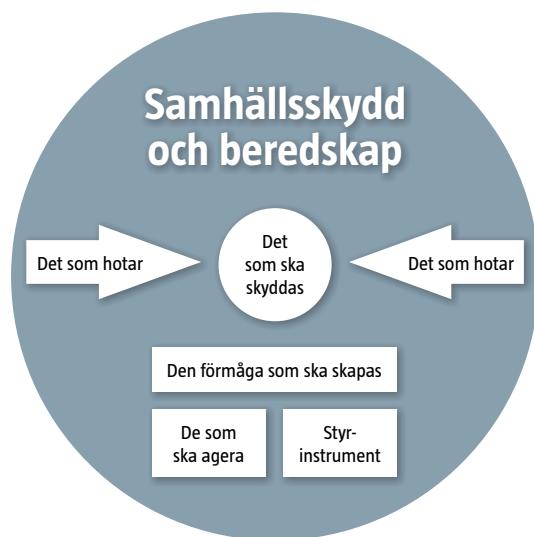
Figur 1. Området samhällsskydd och beredskap beskrivs genom en tankemodell. Kärnan i beskrivningen är behovet att skydda vissa värden (det som ska skyddas) mot oönskade händelser (det som hotar). Förmågan som ska skapas handlar om att förebygga det som riskerar att inträffa och att hantera konsekvenserna av det som inträffar.

Genom att använda tankemodellen för samhällsskydd och beredskap får alla aktörer som har uppgifter inom samhällsskydd och beredskap en gemensam karta att förhålla sig till. Kommunikationen om verksamheten blir mer sammanhållen, och det blir lättare att se var olika frågor möts och vilka eventuella krockar eller inkonsekvenser som måste hanteras eller redas ut.