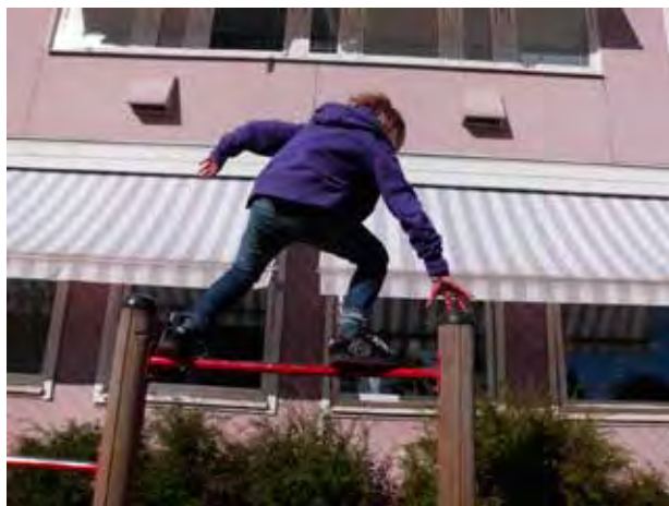
Bild 4. Risker på skolgården.

Många risker på skolgården tas upp. Eleverna visar att de har bra koll på sin egen skolmiljö. En stor grupp deltagare pekar ut trasiga brädor, farliga gungor och hur olika leksaker kan innebära risk. Många av riskerna på skolgården handlar om att klättra , till exempel beskrivs lekredskap, plank, staket och möbler. Deltagarnas beskrivningar visar också att staket många gånger upplevs som en risk i sig, trots att dessa vanligtvis är uppsatta som skydd.