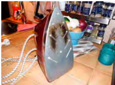
Bild 5. Risker i hemmet.

Risker som uppstår i hemmet förekommer ofta. Särskilt två typer av allvarliga risker lyfts fram: risk för brand om man glömmet levande ljus och risk för olyckor vid hantering av knivar . Andra typer av olyckor är knutna till elektricitet , till exempel risken med att peta i eluttag och risken för att hushållsmaskiner kan börja brinna, särskilt om man glömmet bort att stänga av dem. Deltagarna har lyft fram exempel som brödrost, mikroågsugn och strykjärn. Olika typer av vassa hörn förekommer också ofta. Att göra sig illa på vassa hörn och att klänna sig i dörrar ingår i deltagarnas upplevelse av risker i vardagen.