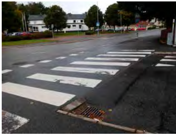
Bild 1. Risker i trafiken.

Många deltagare ser avsaknad av övergångsställen som en allvarlig risk i vardagen. Många lyfter också fram flervägs korsningar och bristande uppmärksamhet hos bilister och gående (till exempel att man går och tittar på sin mobiltelefon i stället för att uppmärksamma trafiken). Flera visar på svårigheter med att cyklister och gående ska samsas om utrymmet på gång- och cykelbanor, andra pekar på svårigheter att synas bakom bilar/ bussar/buskar. Ytterligare några upplever att bilister kör för fort eller inte håller hastighetsbegränsningarna.