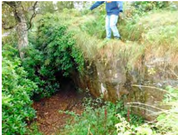
Bild 3. Risker i naturen.

Naturen lyfts fram som ett område där risker uppstår. Deltagarna berättar om risker som ofta har att göra med att man kan ramla och göra sig illa . I naturen kan man halka på till exempel rötter och stenar. Deltagarna berättar om höga kullar, diken och slänter där man kan falla och slå sig. I detta tema ingår också risker som har att göra med naturen i ett bredare perspektiv: ett flertal deltagare har särskilt pekat ut miljöförstöring som en allvarlig risk i vardagen.