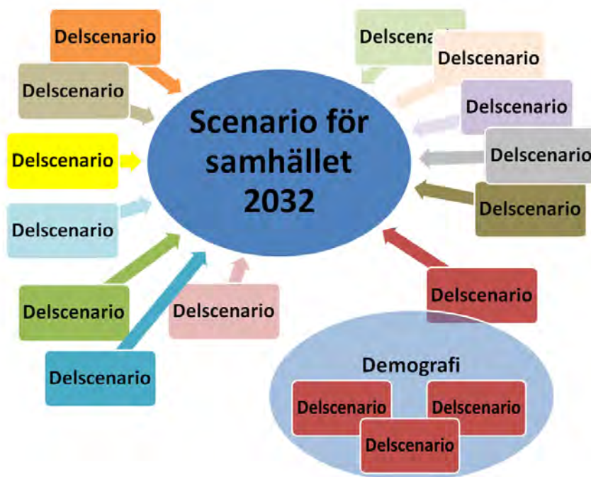
Figur 3. Sammansatta scenarier och delscenarier

ligger dock på olika utmaningar. Detta för att scenarierna tydligare ska kunna skiljas åt och bli mer specifika.