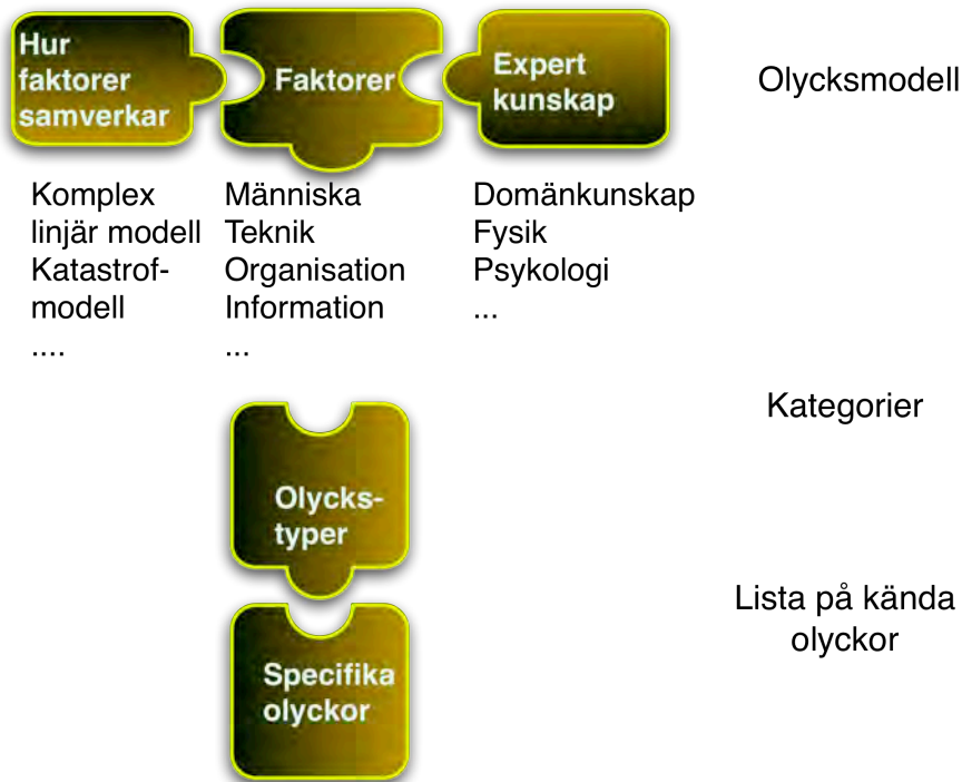
Figur 3.2. Sammanfattning av koppling mellan olycksmodeller och specifika olyckor.

Som visas i figur 3.2 är olycksmodeller en kombination av synsätt på hur faktorer samverkar, vilka faktorer som samverkar, samt expertkunskap. Från en explicit olycksmodell kan man förutsäga olyckstyper (kategorier) som borde kunna uppträda. Kategorierna kan användas för att dela in specifika olyckor i grupper, för att få en överblick av nuvarande svagheter i systemet. Det kan då visa sig att någon kategori är tom. Det kan betyda att man inte undersökt den typen av olyckor ordentligt, eller att någon sådan olycka helt enkelt inte har inträffat. Det kan också visa sig att någon olycka inte passar in i kategorierna, vilket kan tyda på att olycksmodellen är bristfällig. Man kan också gå från andra hållet genom att kategorisera en lista av kända olyckor utan att använda färdiga kategorier. Då kommer kategorierna istället från ett uttalat