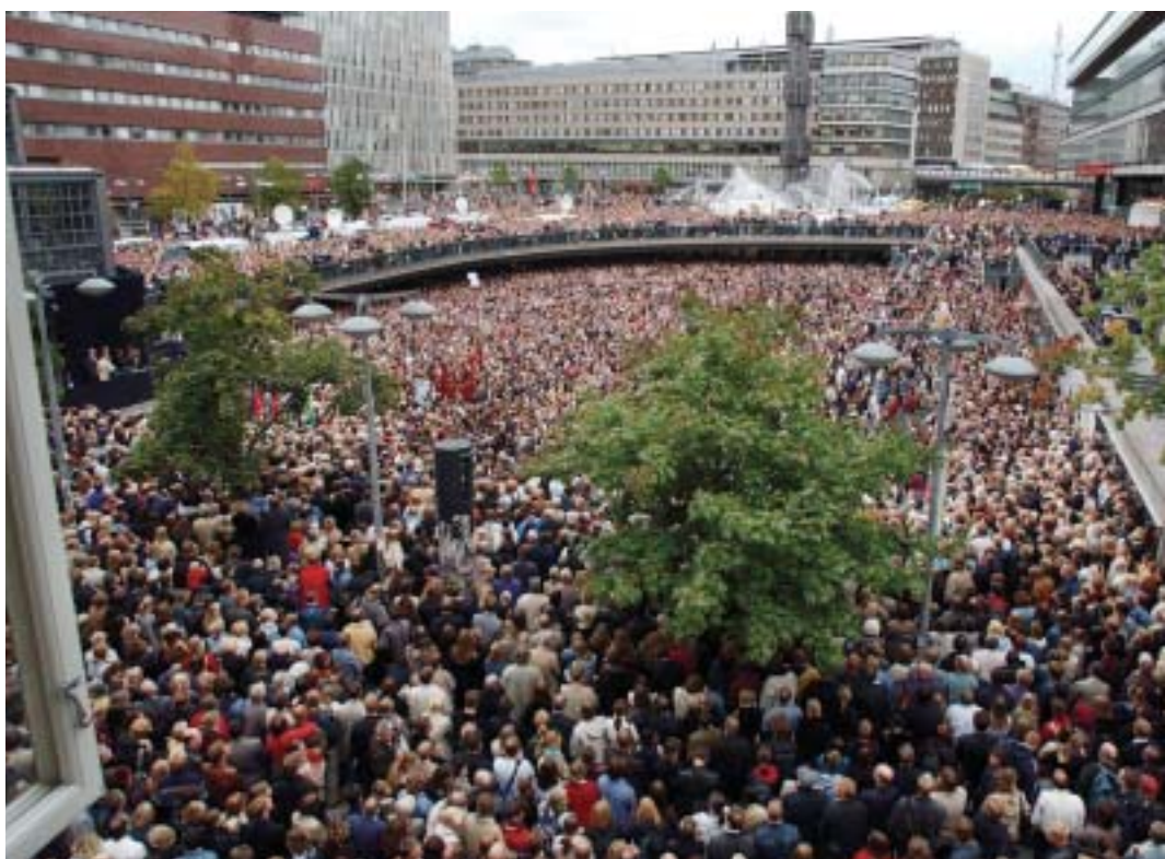
Bild 10. Manifestation på Sergels torg.

en under natten, vad och hur mycket som skulle sägas. När han så kommit hem till barnen omkring klockan 08.30 kan dödsfallet göras offentligt. Men det dröjer ytterligare en dryg halvtimme innan sjukhuset lämnar beskedet om dödsfallet ungefär klockan 09.10 till Tidningarnas Telegrambyrå (TT), beroende på flera tekniska och hantverksmässiga brister. Den presskonferens som är utlyst får under alla förhållan-