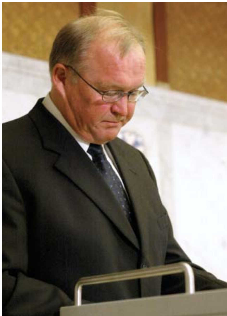
Bild 6. Statsminister Göran Persson meddelar under en presskonferens på Rosenbad på torsdagen att utrikesminister Anna Lindh på morgonen avlidit av sina skador efter knivattacken på NK på onsdagen.