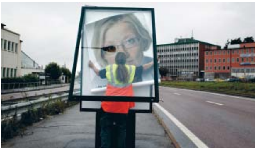
Bild 5. Affischer på Anna Lindh plockas ner.

som att det drunknade totalt, man tänker så här i efterhand att ”javisst, det var en folkomröstning på söndan” (Pressekreterare 1).