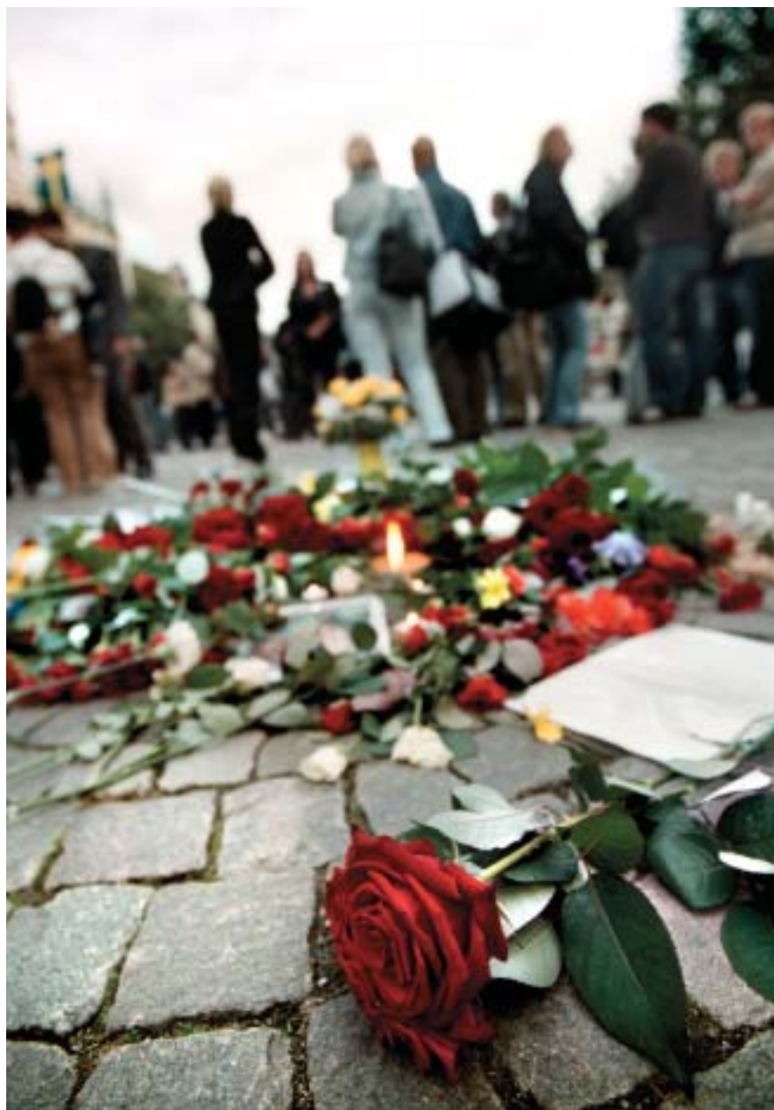
Bild 25. Ljus och blommor i Örebro.