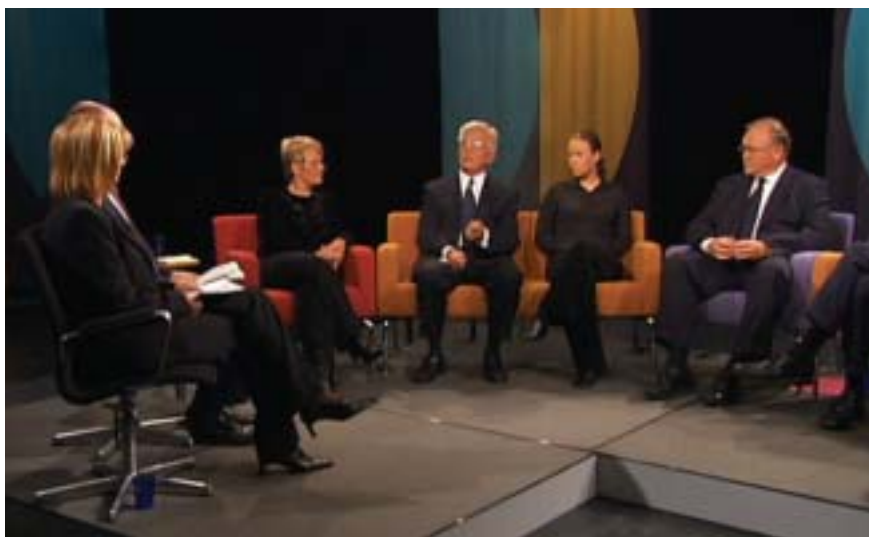
Bild 8. Ett samtalsprogram med partiledare ersatte slutdebatten i EMU-frågan.

mation på webben. Men 4–5 personer ägnar sig åt telefontjänst runt denna krishändelse på de två departementen och Information Rosenbad får sätta in en psykosocial resurs för att ta emot svåra samtal där människor behöver samtalsstöd. Även riksdagen lägger ut information på sin webbplats: ”Vi har tagit till oss /.../ hur viktiga hemsidorna är i information både utanför och innanför /riksdagen/” , säger riksdagens säkerhetschef.