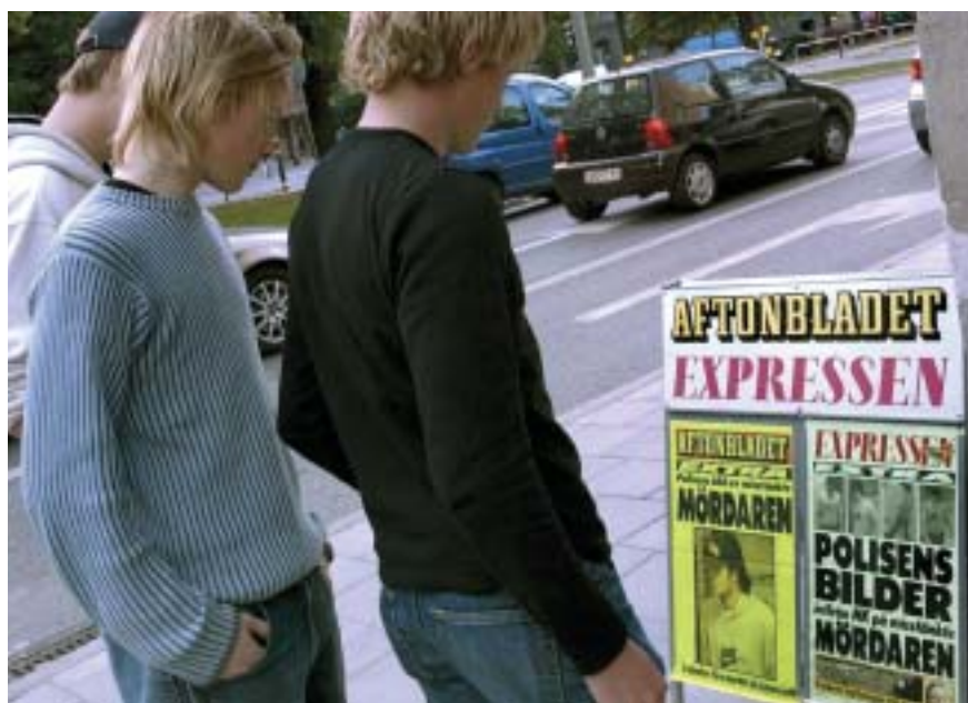
Bild 20. Aftonbladet och Expressen publicerar polisens spaningsbilder på den s.k. NK-mannen 13 september 2003.

Spaningsledningen tar den 12 september emot videoband från NK:s övervakningskameror som kommer att bli mycket betydelsefulla för utredningen. De publicerar bilden på den så kallade NK-mannen på den interna digitala kanalen Kriminalunderrättelsenytt (KUT-nytt) med hopp om att få in spaningsuppslag från poliser som kanske har haft med gärningsmannen att göra tidigare. Spaningsledningen är medveten om att risken är stor att bilden därigenom även kommer massmedierna till del. Den interna publiceringen leder inte till något uppslag. Där- emot läcker bilden omedelbart ut till medierna och publiceras, om än maske-