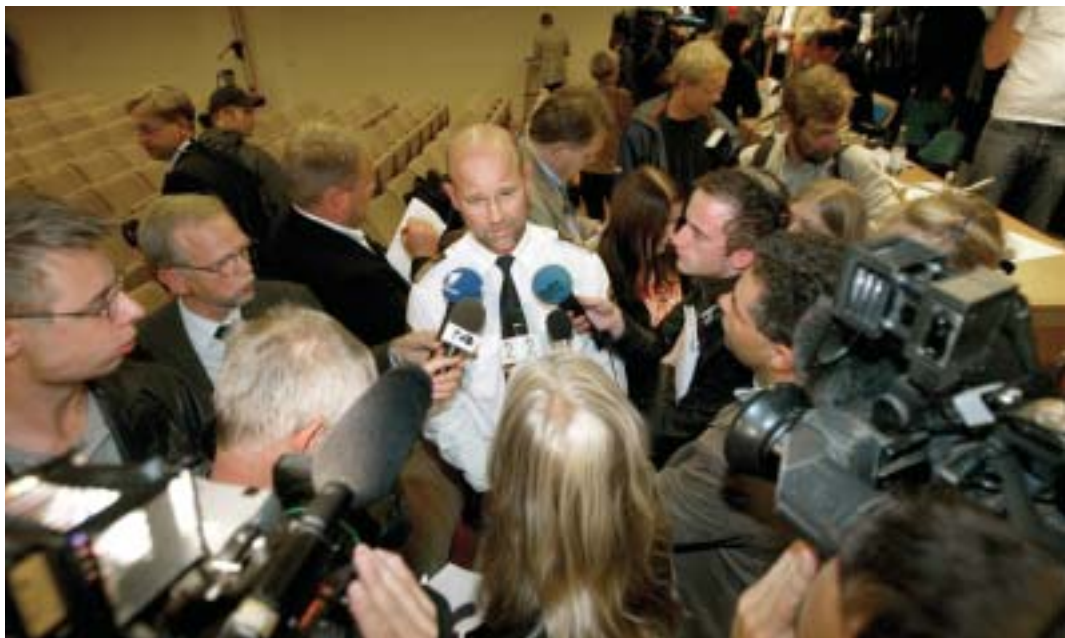
Bild 27. Chefen för länskriminalpolisen, Leif Jennekvist, omringad av journalister vid presskonferens på Polishuset i Stockholm.

antal källor, främst då statsledningen i Rosenbad. Samtidigt skapar denna hanteringsordning ett frö till problem i kommunikationen mellan inblandade parter samt i informationen till medier och allmänhet.