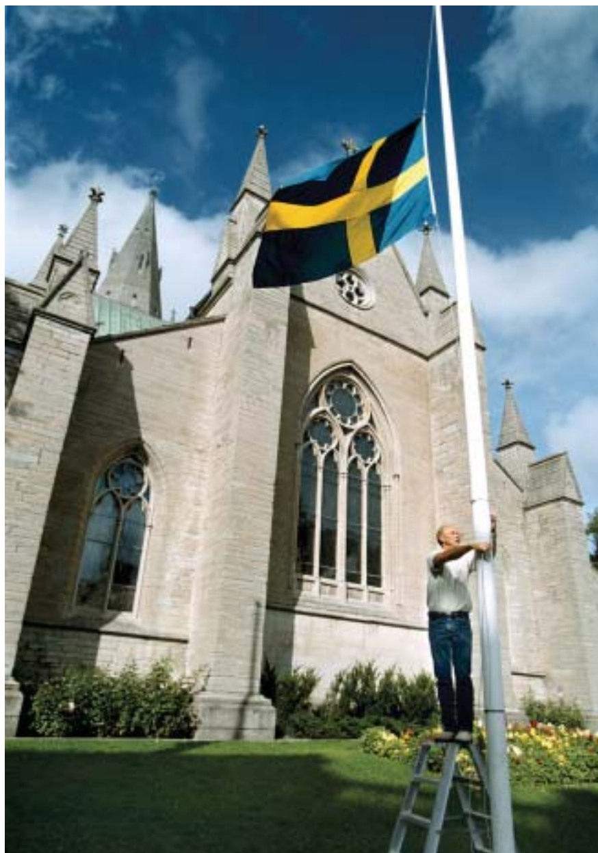
Bild 22. Flaggan halas till halv stång vid Nikolaikyrkan i Örebro.