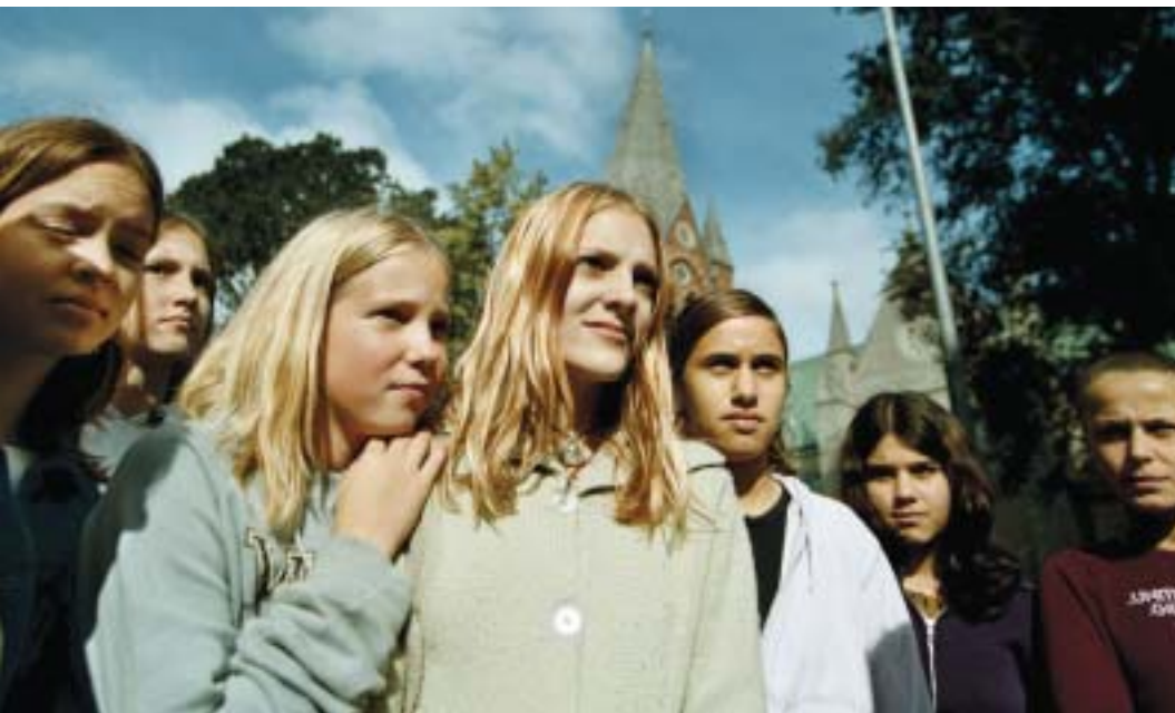
Bild 23. Elever från Brickebackens skola i Örebro.

råd som egentligen gick vid sidan om dem vi redan själva dragit upp. ” Även om inte dådet mot Anna Lindh kom att leda till ökad belastning på funktioner som skolsyster och kuratorer, rådde förstämning på skolan. I samband med attacken mot World Trade Center den 11 september 2001 arrangerades bland annat tysta minuter, men vid Lindhfallet blev manifestationerna vid skolan inte lika kraftfulla.