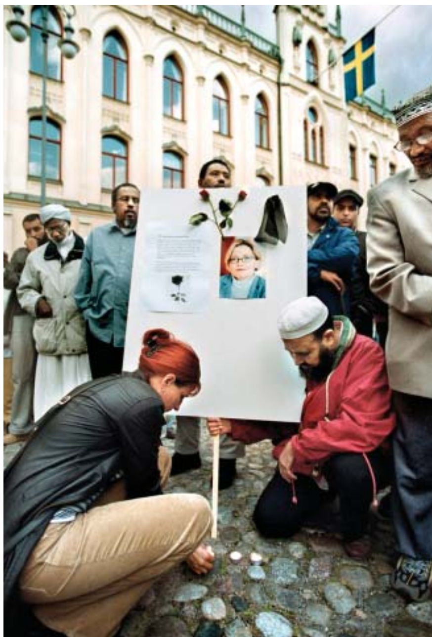
Bild 24. Sörjande örebroare tänder ljus på Stortorget i Örebro.