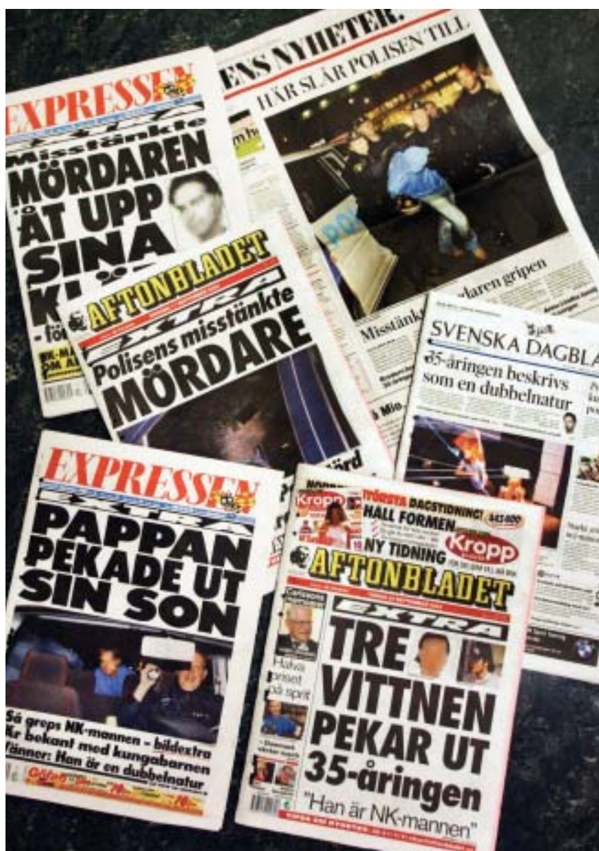
Bild 17. 35-åringens bakgrund exploaterades hårt i kvällspressen vilket komplicerade rättsväsendets arbete.