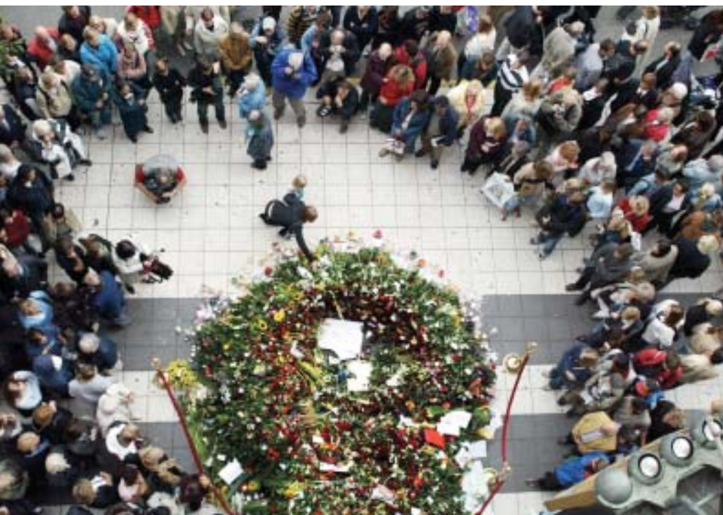
Bild 9. Tusentals stockholmare fortsatte på fredagen att lägga blommor utanför NK.

ningen. Kyrkan bistår exempelvis med präster som närvarar vid riksdagens öppnande och den minnesstund som då genomförs. Över huvud taget menar en företrädare för riksdagen att detta organ fått en mer betydelsefull roll