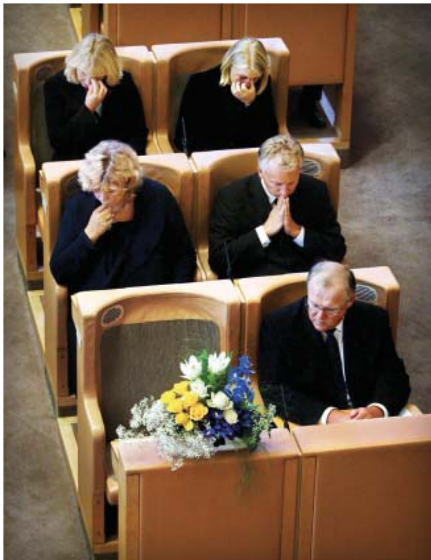
Bild 12. Regeringsledamöter vid Anna Lindhs bänk när riksdagen öppnades för höstens förhandlingar. Riksdagen höll en tyst minut till hennes minne.