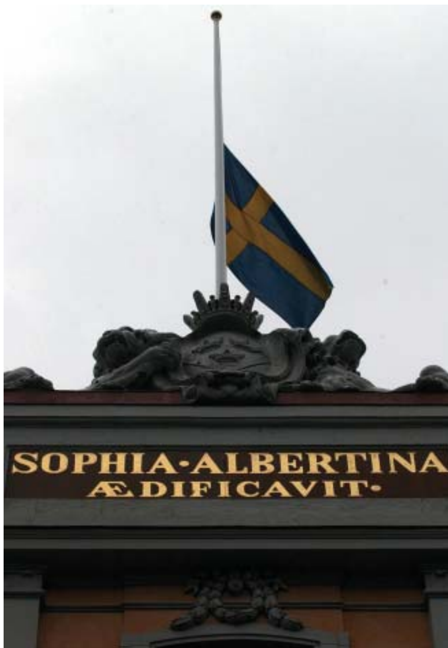
Bild 4. Svenska flaggan på halv stång vid UD.