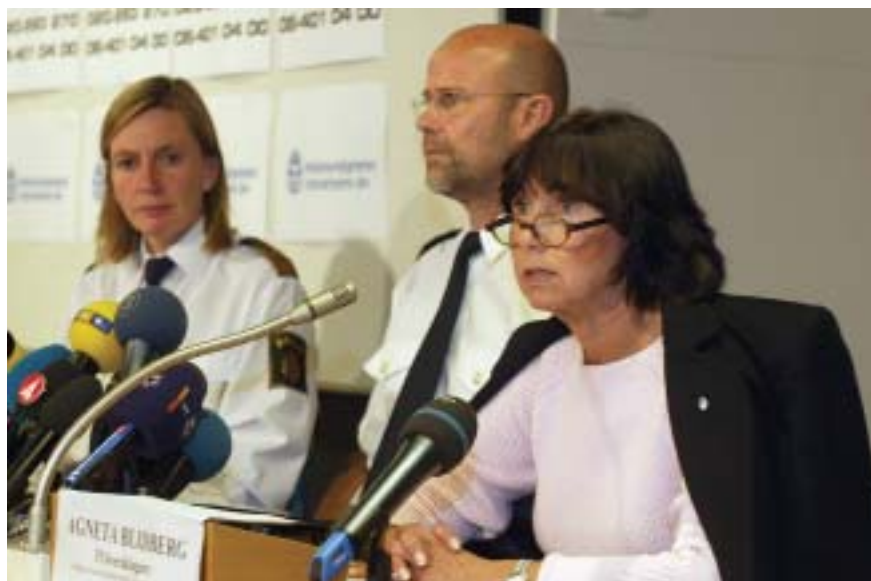
Bild 16. Carin Götblad, länspolismästare, Leif Jennekvist, chef för länskriminalpolisen, och Agneta Blidberg, t.f. överåklagare och förundersökningsledare, vid presskonferens den 17 september 2003 (den sista av sju presskonferenser hos polisen).

Presskonferensen upplevs som en svårarbetad form för kontakter med medierna. Märkt av tidigare erfarenheter finns inom polisen en rädsla att presskonferenserna uppfattas som ett spektakel som kan skada allmänhetens förtroende för rättsväsendets arbete.