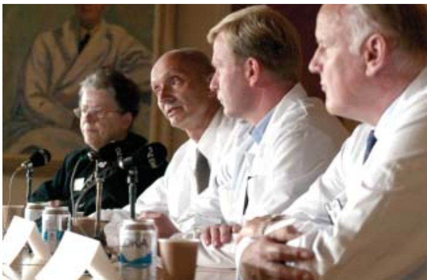
Bild 19. Presskonferens på Karolinska sjukhuset om hur traumaomhändertagande går till, med anledning av utrikesministerns död och vården av henne på sjukhuset.

operation så gick inte det att göra helt enkelt. Personalen hade behov av att bearbeta den här händelsen som de upplevt. Det är alltid ett trauma när man mister en patient (Informatör vid KS).