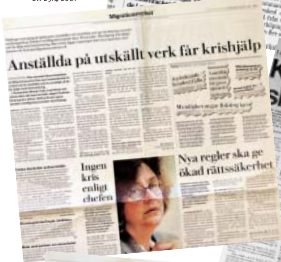
DN 29/4 2001