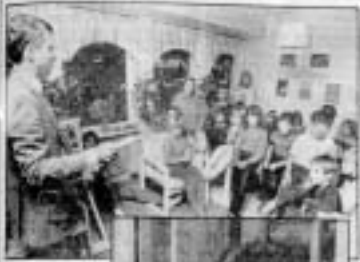
Skolans lärare berättar för eleverna om betydelsen av att vaccineras mot difteri. Bilden till höger visar en av de barn som ska vaccineras.