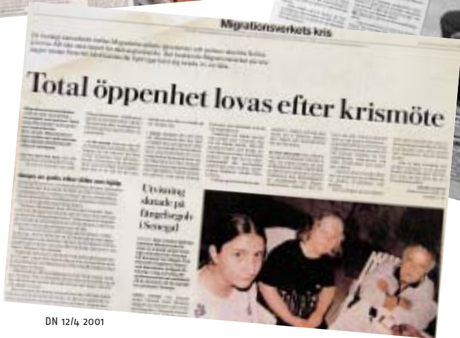
DN 12/4 2001