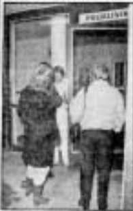
En person i akutmottagning väntar på att bli undersökt. Akuten öppnades i går på Östra sjukhuset.

— Det är fullkomligt kaos här, och strängt ständigt på Östra i går kväll.