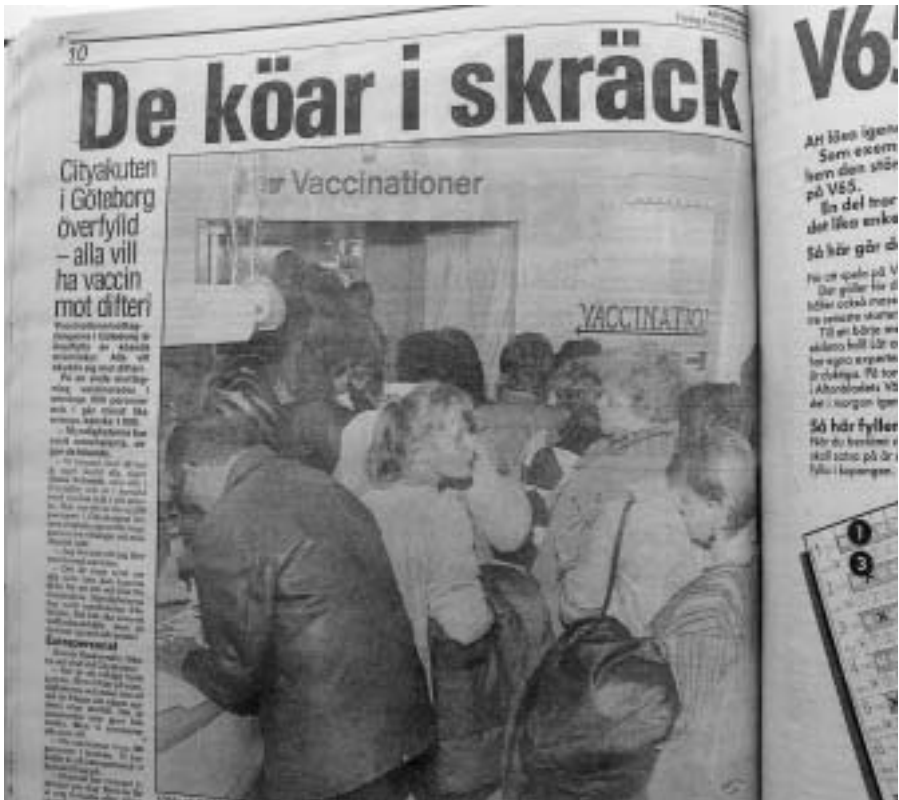
AB 6/11 1984

mot World Trade Center i New York i september 2001 är ett liknande exempel. Andra exempel är Estoniakatastrofen och diskoteksbranden i Göteborg. Men även vid mindre kriser uppstår inte sällan likartade fenomen. Något hårdraget kan man dessutom påstå att vid relativt omfattande kriser och när situationen är oöverskådlig och bristen på tillförlitliga källuppgifter är stor, är publikens informationsbehov som störst. Då använder medierna de uppgifter som finns att tillgå.