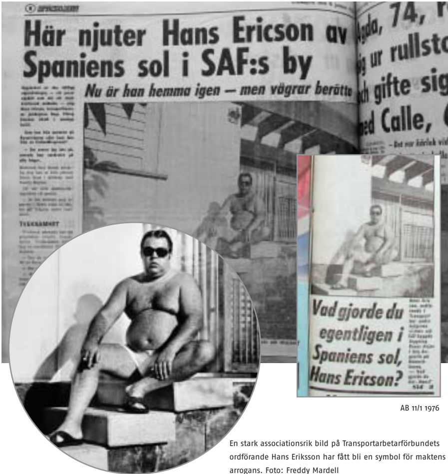
AB 11/1 1976