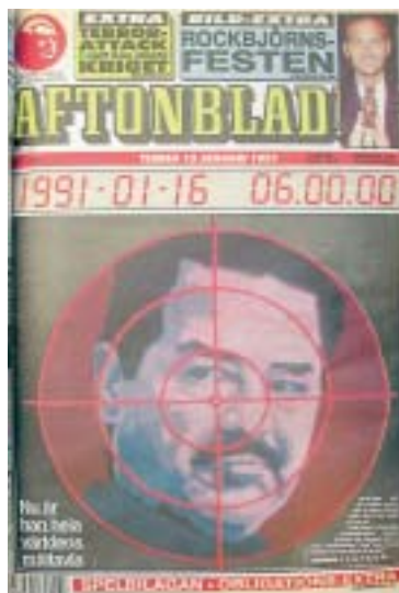
AB 15/1 1991

Verklighetsbeskrivningar i någorlunda kontroversiella frågor, som många kriser, kan sannolikt inte vara helt neutrala och gör ofta inte heller anspråk på detta. Språket har också en övertygande betydelse. Bland alla metoder att påverka och övertyga som förekommer i medierna är enligt en del forskare de språkliga de mest effektiva. I konflikter blir de språkliga påverkansmetoderna särskilt tydliga. Vid analyser av exempelvis nyhetsbevakningen från Falklandskriget visas att språkliga medel användes, bland annat för att markera perspektiv och för att framhålla den egna sidan. Språket i de brittiska nyhetsmedierna var mycket partiskt. Exempel på detta språkbruk är att fiendens förluster genomgående beskrevs med "mjuka" eller emotionellt svaga ord medan den egna sidans förluster beskrevs med "hårda" eller emotionellt starka ord. Nyhetsförmedling innebär också att intressera publiken för det som behandlas. Nyhetsmedierna använder bland annat språket för att framställa händelser och förhållanden som de antar att publiken vill ha dem. Nyheterna presenteras därför på ett sätt som journalisterna tror överensstämmer med publikens kunskaper och åsikter. Publiken vill att nyheter ska vara intressanta och spännande. En grundregel är att nyhetsspråket normalt förstörar vikten hos och dramatiserar händelser och förhållanden i verkligheten för att uppnå detta. Det finns alltså språkliga metoder som används mer eller