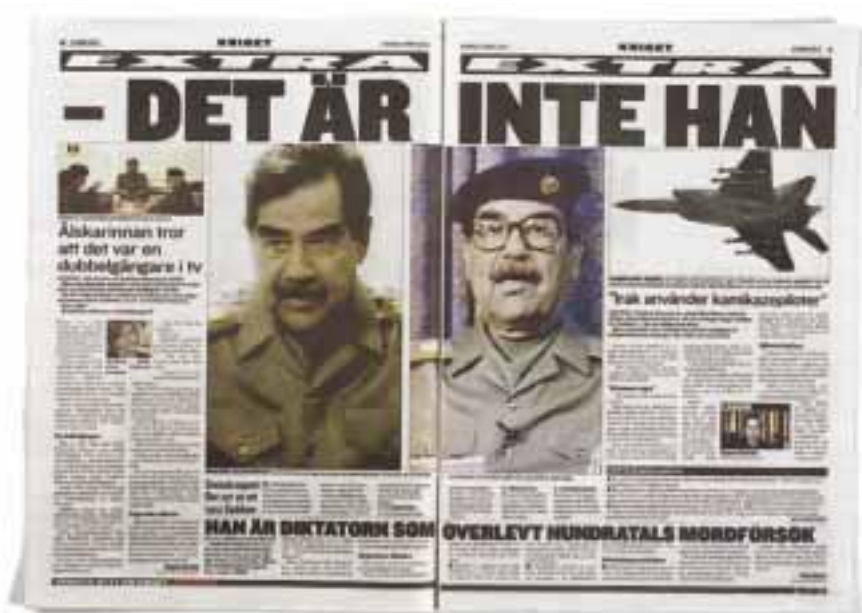
16. Expressen, 10–11, 21 mars 2003.