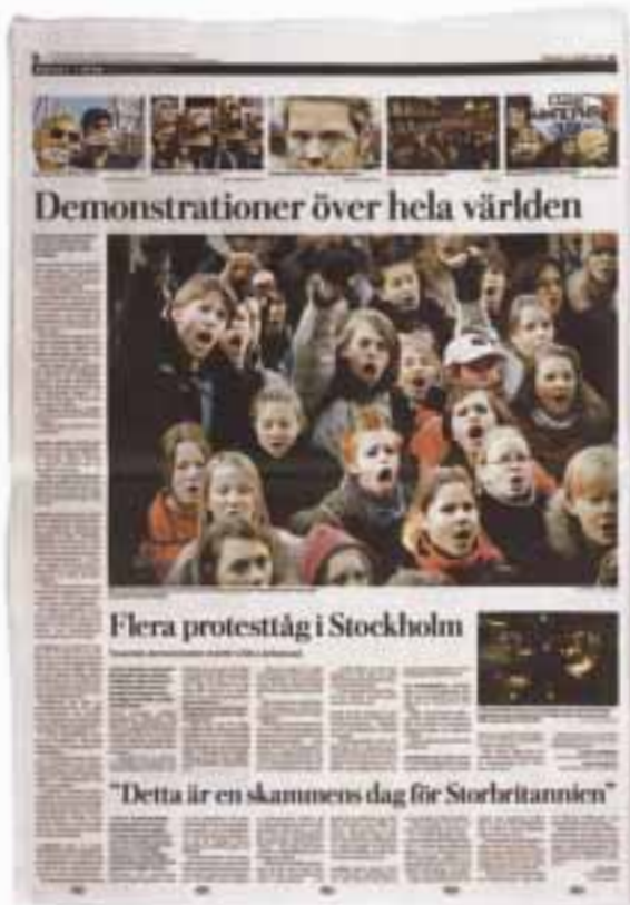
13. Dagens Nyheter, 8, 21 mars 2003.

kämpa mot den "lille Bush" som han kallar Bush jr, förmodligen för att skilja honom från "store Bush" som var huvudfienden under Gulfkriget.