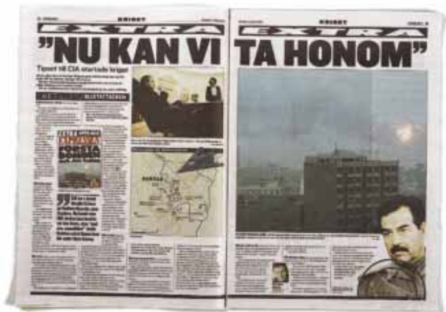
17. Expressen, 12–13, 21 mars 2003.