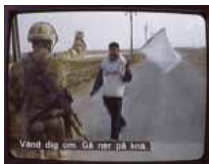
Vänd dig om. Gå ner på knä.

Tidigare på krigets andra dag nära staden Umm-Qasr i södra Irak.