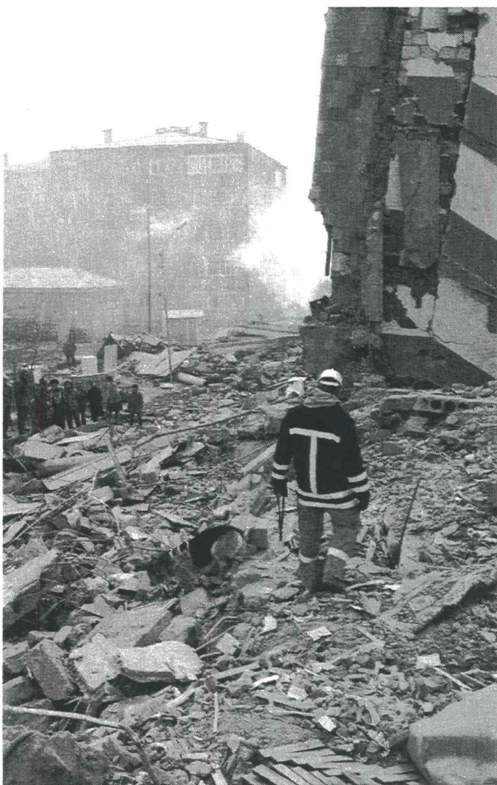
16 svenska räddningshundekipage deltog vid den omfattande jordbävningen i Armenien 1988.

Svenska räddningshundekipage har vid ett tidigare tillfälle medverkat vid en sök- och räddningsinsats utomlands. Detta skedde i december 1988 då 16 svenska ekipage medverkade i samband med den omfattande jordbävningen i Armenien i dåvarande Sovjetunionen. Under insatsen markerade svenska hundar för omkring 100 levande människor. På grund av den långa tiden för att gräva fram överlevande, ibland mer än 20 timmar, så hade den svenska styrkan inte ens då de lämnade Armenien fått definitiv bekräftelse på riktigheten i hundarnas markering. Helt klart är dock att 14 av de svenska markeringarna bekräftats som överlevande människor som räddades tack vare de svenska ekipagen.