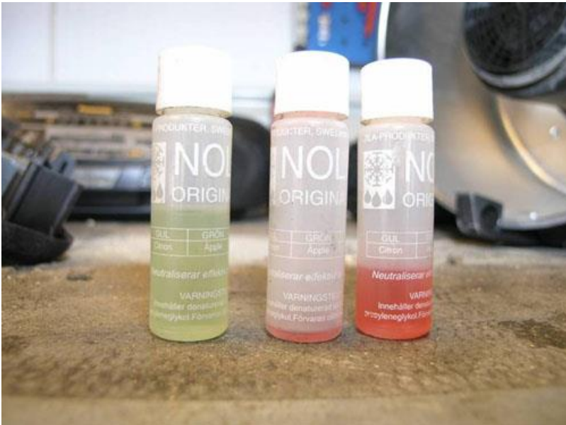
De tre flaskorna med doftmedel som låg i dammsugaren. Innehållet var mycket lättantändligt visade ett prov