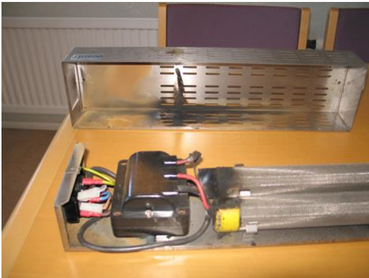
Röksaneringsmaskinen är isärtagen.