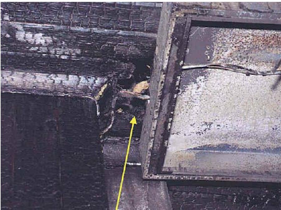
Det finns kraftiga kolningsskador i taket, i anslutning till aktuell lysrörsarmatur. (Anm. Viss "skorstensverkan" vid brandtillfället kan ha gjort att kolningsskadorna blivit