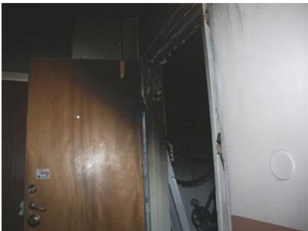
Branden hade spridit sig ut till trapphuset via lägenhetsdörren som stått öppen under brandförloppet.