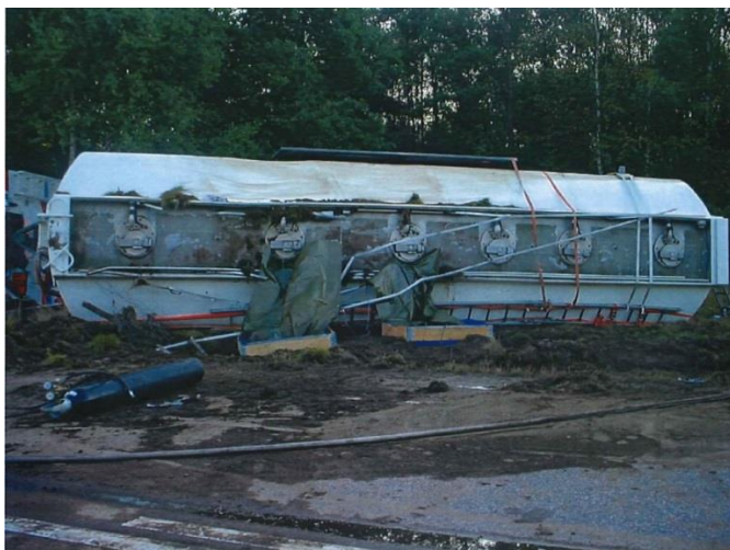
Figur 2-1 Olycka med tankfordon.

Håltagning i tankar delas in i följande tre grupper utgående från innehållets tillstånd: