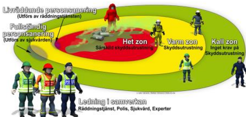
Figur 5-1 Zonindelning av olycksområdet.

Räddningstjänsten kan göra en fysisk zonindelning i samband med att en olycka inträffat eller att det finns en påtaglig risk för olycka. En förutsättning är dock att det primärt rör sig om kommunal räddningstjänst, d.v.s. att lagstiftningens definition av kommunal räddningstjänst är uppfylld [SFS 2003:778]. Syftet med en zonindelning är att skydda allmänheten och skapa utrymme för räddningstjänsten att arbeta ostört. Figur 5-1 visar indelning av olycksområdet i het, varm och kall zon. Kraven på skyddsutrustning är högst i het zon. Utförligare information om på vilka grunder zonindelningen görs och hur arbetet organiseras inom olycksområdet finns att hämta i [Planering och samverkan vid händelser med farliga ämnen].