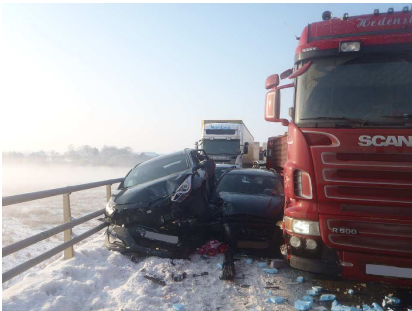
Foto 2: Personbilar klämda mellan räcke och lastbil

De drabbades perspektiv undersöktes genom en intervjustudie några månader efter olyckan. Det fanns både positiva och negativa kommentarer omkring olyckan. De positiva kommentarerna handlade om att räddningspersonalen, under rådande omständigheter, skötte det hela bra och att omhändertagandet var helt fantastiskt. De negativa kommentarerna handlade bland annat om väglaget, om det rådande vinterklimatet i Sverige och om informationsbrist. Det stora flertalet verkade förstå och acceptera att räddningsarbetet tog tid, eftersom det var en stor och omfattande olycka.