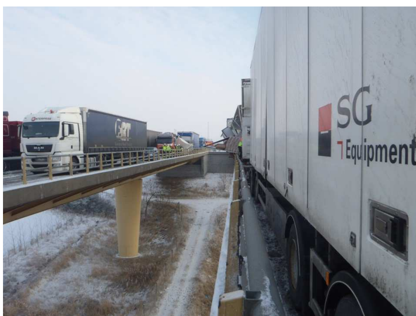
Foto 1: Avstånd mellan vägbanor.

I och med att olyckan inträffade på två separerade körbanor på bron blev det två skadeplatser och därmed omöjligt att flytta personal och utrustning mellan de två skadeplatserna. Framkomligheten för blåljusorganisationernas fordon till olycksplatsen var begränsad liksom tillgängligheten för personalen som arbetade på platsen.