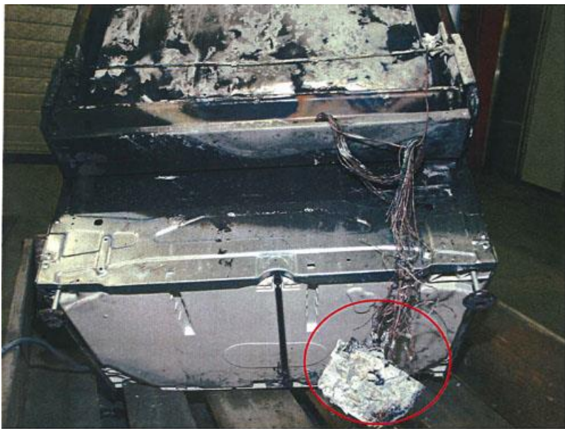
Bild 5. Rester av programheten.