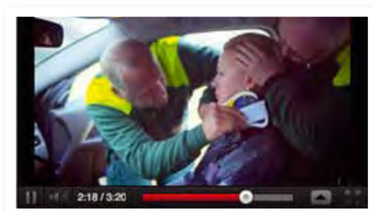
Filmen lär dig om hur du larmar nödnumret 112.

Varje år omkommer omkring 3 000 personer i olyckor, nästan 110 000 skadas svårt och nästan 500 000 skadas lindrigt.