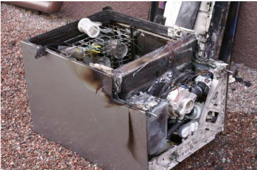
Brand i Diskmaskin