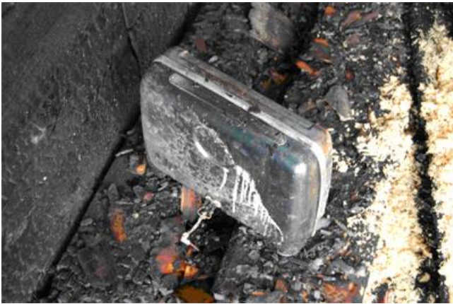
Strålkamin 1200 W.

Rapport tillsänds Statens Räddningsverk Gert Lönnqvist Brandutredare