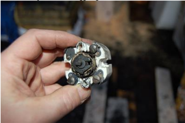
Strömställaren ställd på max effekt.