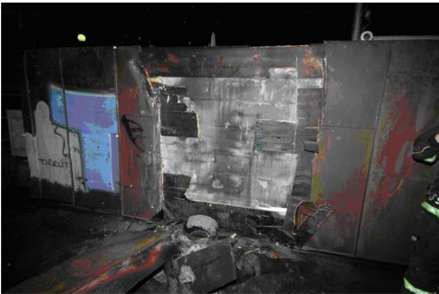
Väggen som skorstenspipan stod dikt mot samt delar av skorstenspipan