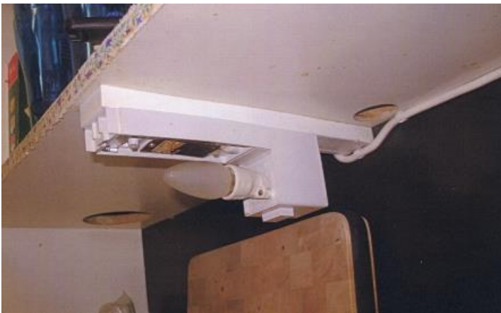
Bilden tagen på en trinettekös belysning som inte är brandskadad.