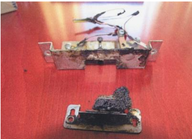
Resterna av den uppbrända kontakten.