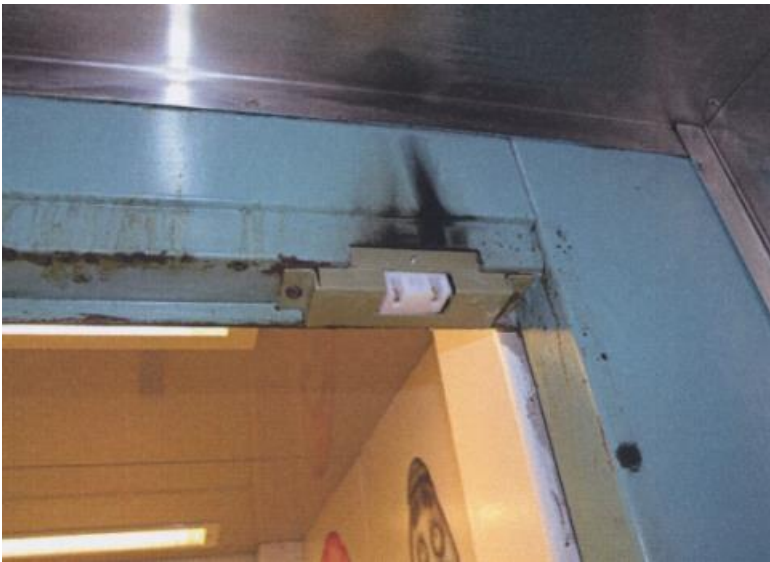
En ny kontakt är ditsatt där den som brann satt. På båda sidor av kontakten syns att det finns ränder av matfett.