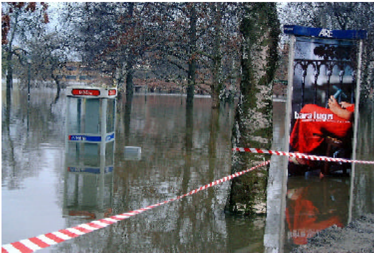
Stadsparken i Arvika

Massmediabevakningen under insatsen följde vattenståndet. När ökningen var som mest dramatisk hade såväl TV som radiostationer journalister och sändarfordon på plats. Media från övriga nordiska länder var också representerade. Under tiden 11-27-12-07 fanns utbildade informatörer på plats i Försvarets mobila presscenter. Uppgifterna för dessa var att lämna interninformation till FM personal i Arvika, producera material (text och bilder) för FM websidor på Internet samt ge erforderlig service åt journalister och andra besökare. Efter den 7 december löstes detta mera begränsat av lämpliga värnpliktiga. På MD M hemsida kunde ett mycket stort antal besökare registreras.