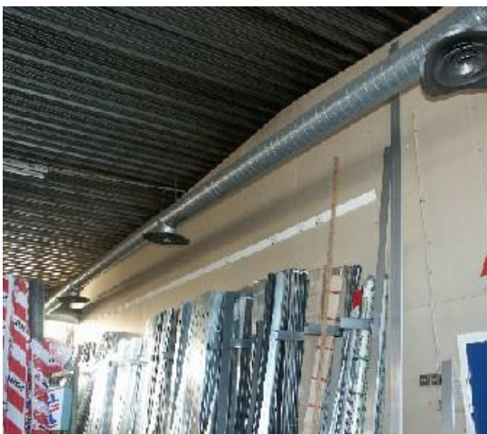
En inte helt tät mellanväggsanslutning mot trappetsplåttak har medfört rökspridning.