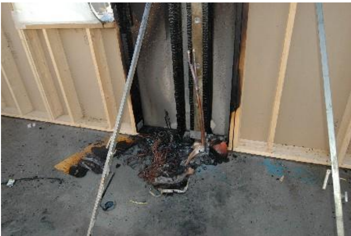
Fiberskiva samt rester av värmefiltten.

Filtten användes felaktigt ihoprullad med en fiberskiva ovanpå för att förhindra värmeförlust. När temperaturen steg under dagen räckte inte kylan till för att kyla ner filten och den började brinna.