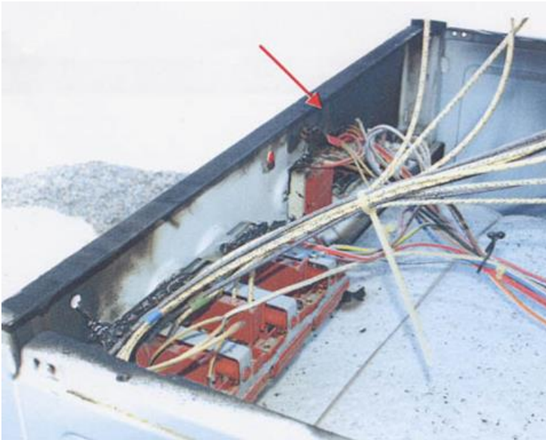
Branden har varit koncentrerad till den elektriska komponenterna. Primärbrandområde vid pilen.

Lägenheten var belägen i ett radhusområde i området X i X-by. Det som brunnit var spisen, dock ej som vanliga fall något på spisen, utan inuti spisen. Spisen var av typen "häll" och märket var märke X. Ett nummer fanns angivet på chassit. Familjen hade satt på ugnen för att värma pommes frites och branden inträffade efter några minuter. Vid närmare undersökning visade sig att det var elektriskt material och en gummilist som tätar mellan hällen och chassit som deltagit i branden. En elektrisk smältskada återfanns på ett stift som förband ugens funktionsväljare med en signallampa. Detta tyder på att branden orsakats av en ljusbåge till följd av glappkontakt mellan ett stift och en ledare. Husets jordfelsbrytare hade utlösts i samband med branden. Brandvarnare fanns, men saknade fungerande batteri.