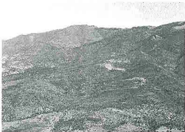
Det behövs inte bara hjälp med att bygga upp ett fungerande brandförsvaret. De behöver även hjälp med återplantering av skogen. Hälften av Makedoniens totala skogsareal har brunnit.

Observatörsinsatsen utmynnade i en insats för Nato/EADRCC som innebar att Räddningsverket sände brandmaterial till Makedonien. Materialen placerades vid några av de frivilliga brandkårerna på landsbygden och cirka 100 personer utbildades för att kunna hantera brandsprutor och annat. Förhoppningsvis står de bättre rustade inför kommande skogsbrandssäsonger.