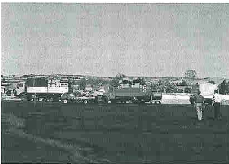
Släckutrustningen för skogsbrand har anlänt. Utrustningen lastades på fyra lastbilar för vidare transport till huvudbrandstationen i Skopje

Förberedelser under förmiddagen för utbildningar och alla övriga detaljer. Planet landade kl 15.15 på flygplatsen i Skopje, hundra turer senare och tio olika ingångar hittade vi rätt. Vi kom med personbil och fyra lastbilar och fick åka direkt ut på plattan. Kl 15.45 började vi lasta av planet och planet lyfte mot Arlanda kl 17.20. Mycket bra jobbat! Vi körde i konvoj mot huvudbrandstationen i Skopje. Schemat bestämdes inför morgondagen, samling brandstationen i Skopje kl 08.15 för presskonferens och därefter packas utrustningen upp av brandmännen och vi får resten av dagen ledigt .