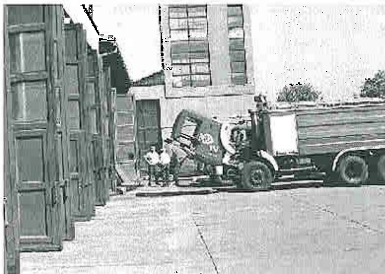
En vanligt förekommande syn på brandstationen i Skopje. De flesta släckbilar är 20 år gamla eller mer.

Brandförsvaret i Makedonien är organiserat direkt under Inrikesministeriet. Makedonien är uppdelat i tre regioner med heltidsanställd brandpersonal i varje distrikt. Det finns en huvudbrandstation och fyra brandstationer i staden Skopje. Brandförsvaret har en traditionell organisation med en förebyggande avdelning och en uttryckande avdelning. Det finns tre nivåer av brandbefäl på brandstationerna; brandförman och brandmästare och växer insatsen kommer insatsledare/överbrandmästare ut och övertar ledningen. Insatsledare/överbrandmästare finns endast på huvudbrandstationen i Skopje. Bemanningen är 44 man per skift, 20 stycken på huvudbrandstationen och resterande fördelade på de övriga fyra stationerna. Specialresurser är stationerade på huvudbrandstationen och larmas då till hela republiken. Ett exempel är klippverktyg som bara finns på ett fordon i hela Makedonien, det fordonet var cirka 25 år gammalt. Brandstationerna samarbetar i viss mån med de frivilliga brandkårerna; när bränderna når en viss storlek åker de ibland ut för att medverka vid släckningen. Personalen arbetar i snitt 42 timmar i veckan och är uppdelade på fyra skift. Normallönen för en brandman är cirka 1 000 DM i månaden. Högsta befälet har cirka 2 000 DM i månaden.