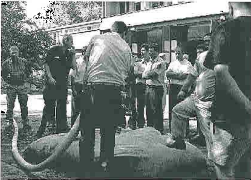
Totalt skänktes 36 gummitankar. Här utbildas brandmännen i hur dessa ska hanteras.