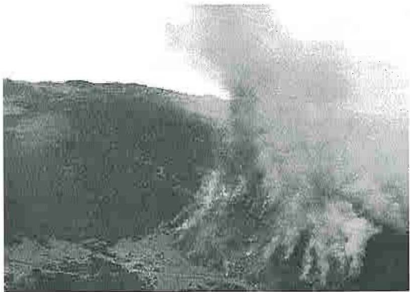
Svarbrända berg så långt ögat når.

Många av skogsbränderna utbryter i väldigt otillgängliga områden som helt saknar vägar. Detta innebär att vid många tillfällen har brandpersonalen mellan två-fyra timmars gångväg innan de når branden. Behovet av hjälp är stort på många områden .