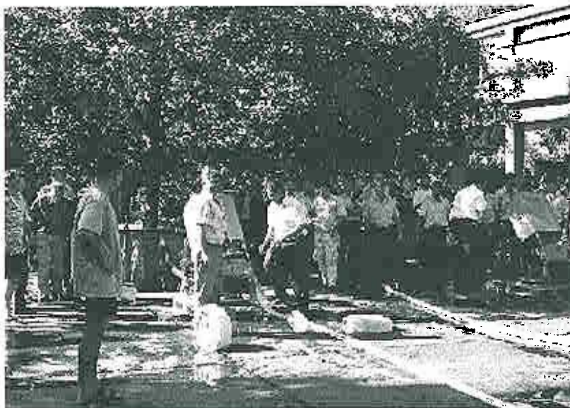
Utbildning på motorsprutor och slangsystem för brandmän på huvudbrandstationen i Skopje. Totalt utbildades 100 brandmän på två dagar.

På morgonen började utbildningen av brandpersonal. Brandpersonalen delades i tre grupper, en till varje pump. Vi fördelade oss på pumparna och sen körde vi igång, det gick mycket bra. Utbildningen tog cirka tre timmar och då hade vi gått igenom all utrustning. Rapport till Räddningsverket, NATO och RC .