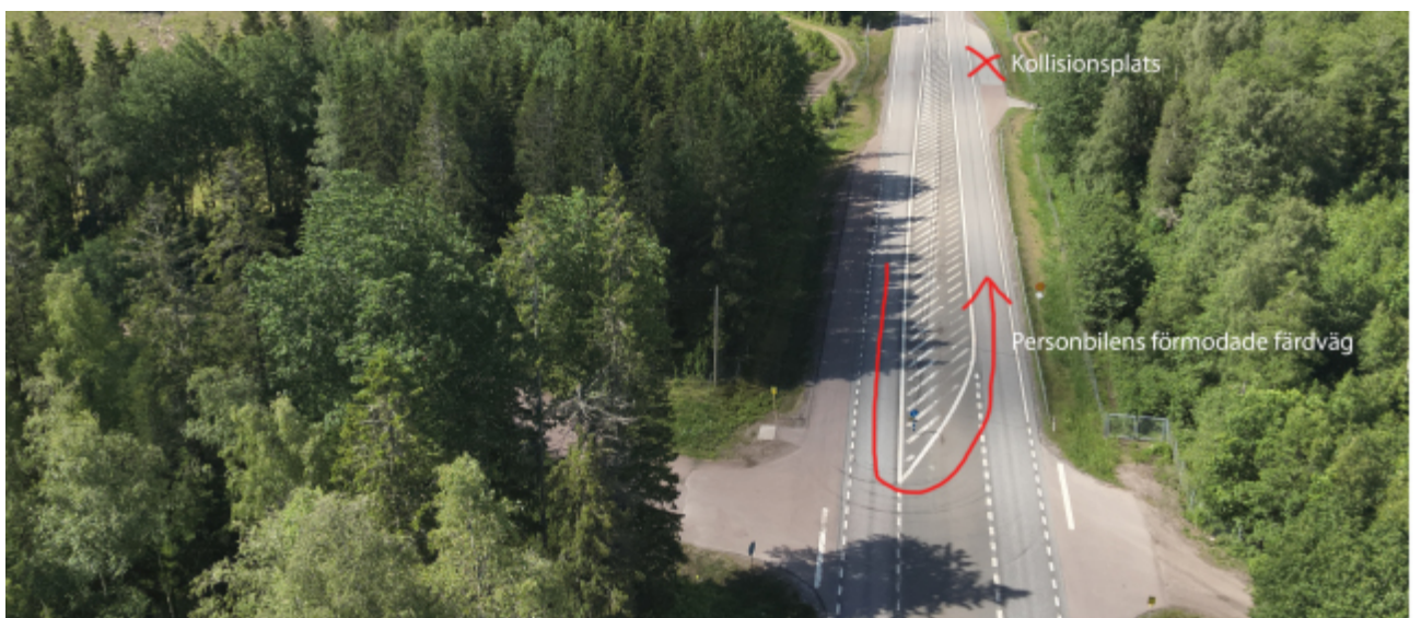
Personbilens förmodade färdväg