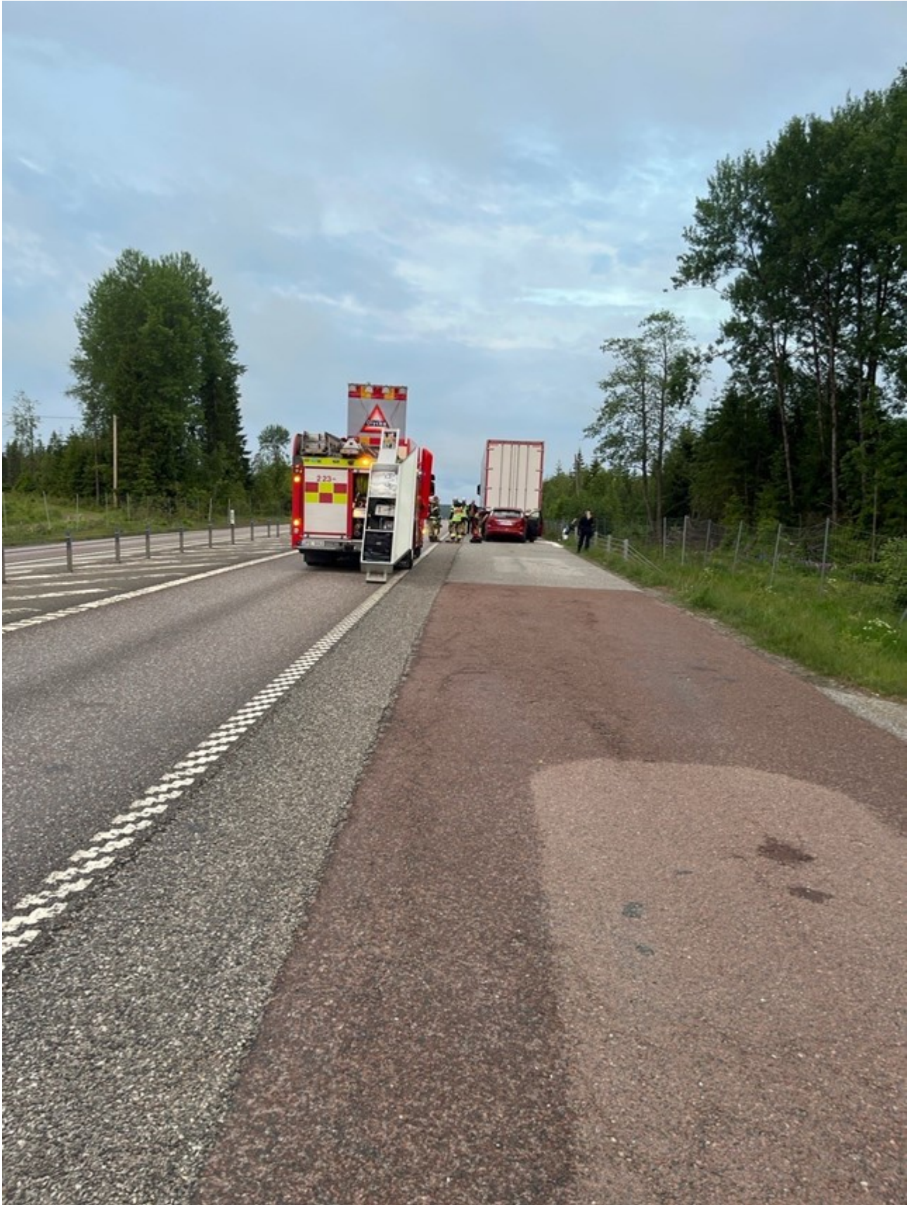
Bild taget från öster vid olyckstillfället