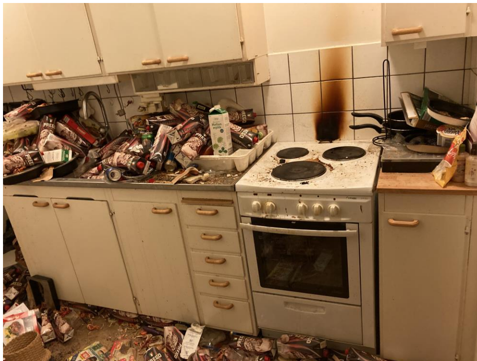
Bild över kök.