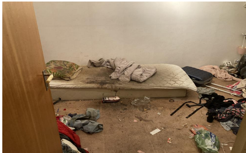
Bild över sovrum.

Räddningstjänsten Östra Götaland Albrektsvägen 150 602 39 Norrköping