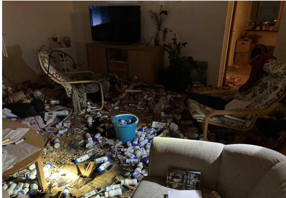
Bild över vardagsrum.