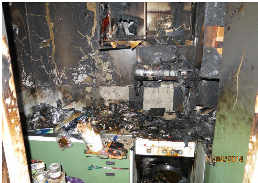
Bild över kök/ kokvrå