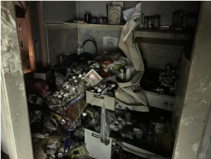
Bild över kök/ kokvrå.

Räddningstjänsten Östra Götaland Albrektsvägen 150 602 39 Norrköping