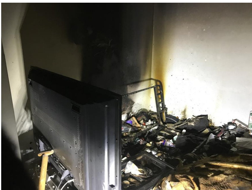
Bild över sängen.

Räddningstjänsten Östra Götaland Albrektsvägen 150 602 39 Norrköping