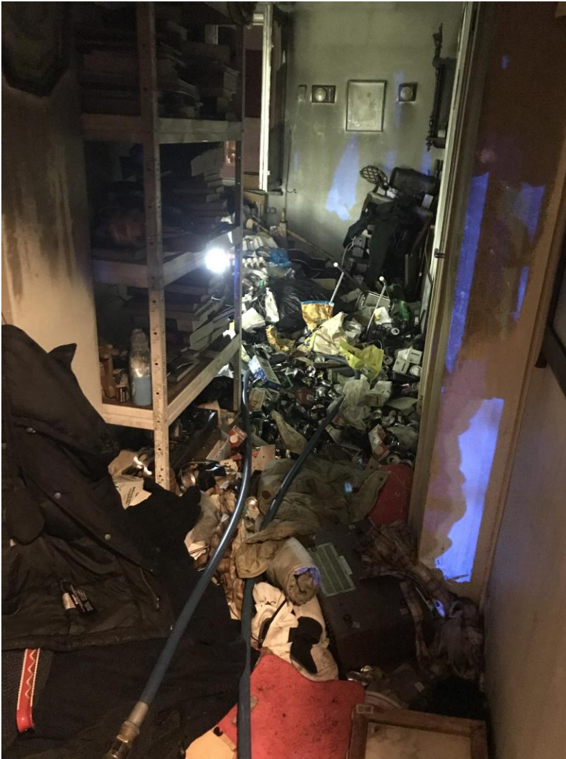
Bild från entrédörr.

Räddningstjänsten Östra Götaland Albrektsvägen 150 602 39 Norrköping