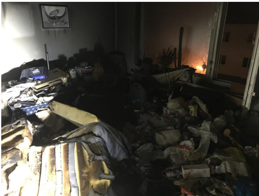
Bild över rummet.