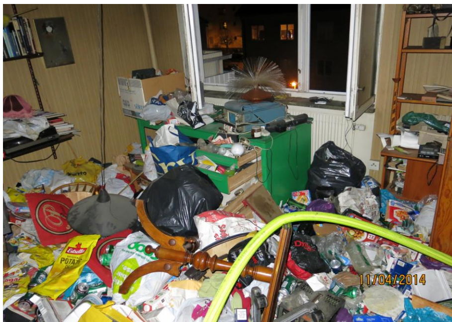
Bild över rummet.