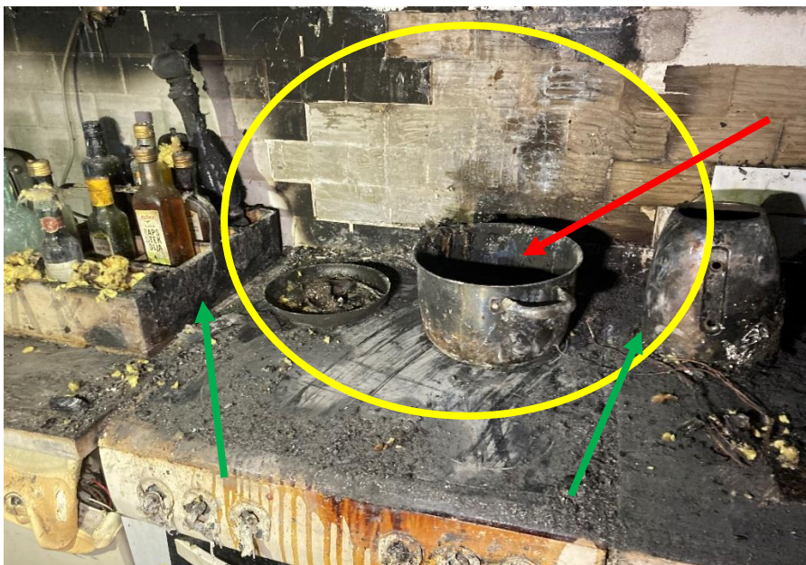
BILD 3: Gula cirkeln visar det primära brandstartsområdet. Röda pilen visar kastrullen som innehöll matolja och som stod på plattan som var påslagen på högsta effekt. Gröna pilarna visar de brandskador som finns i höjd med spishällen.