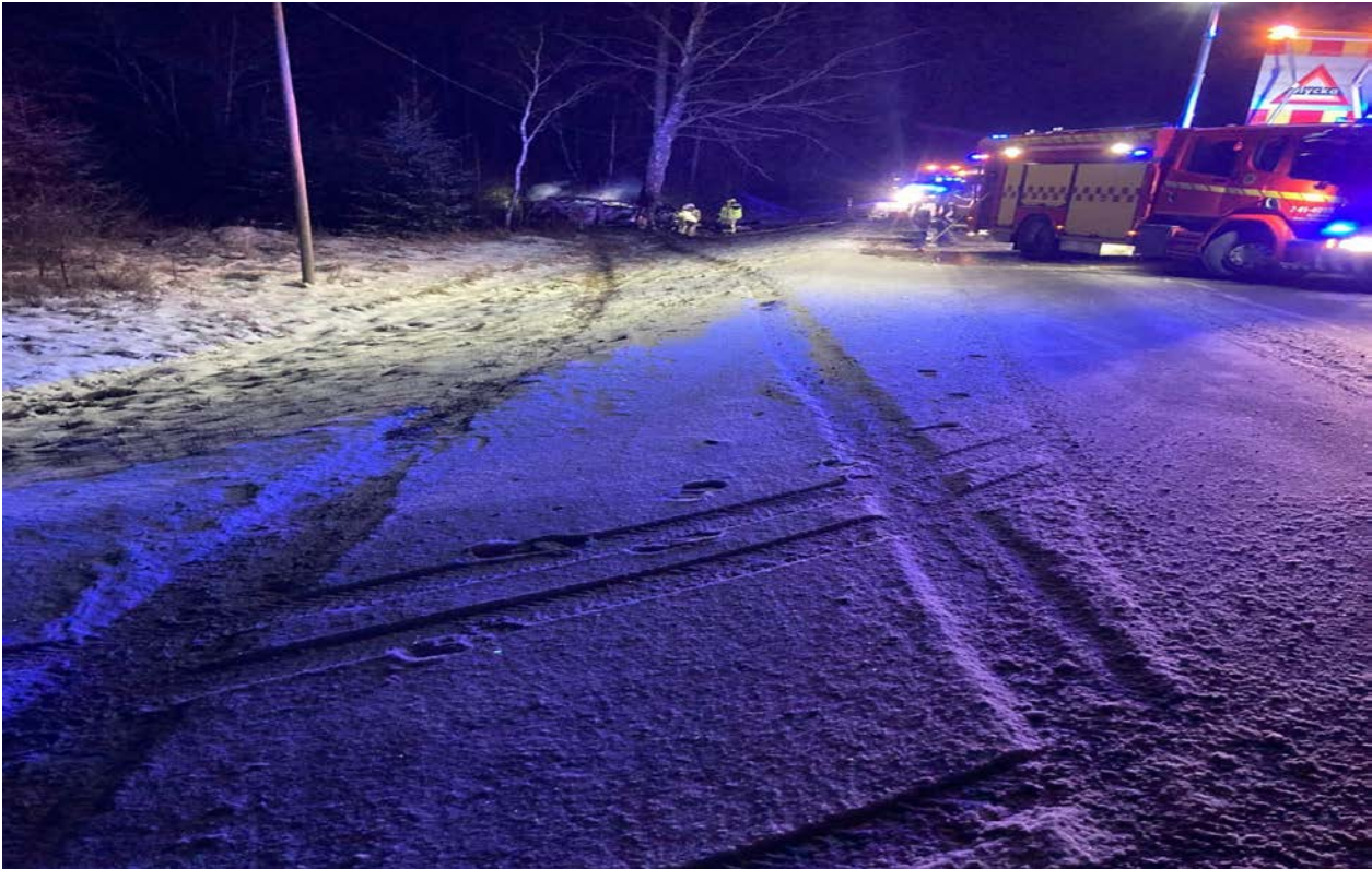
Bild 1. Bild från olycksplatsen.