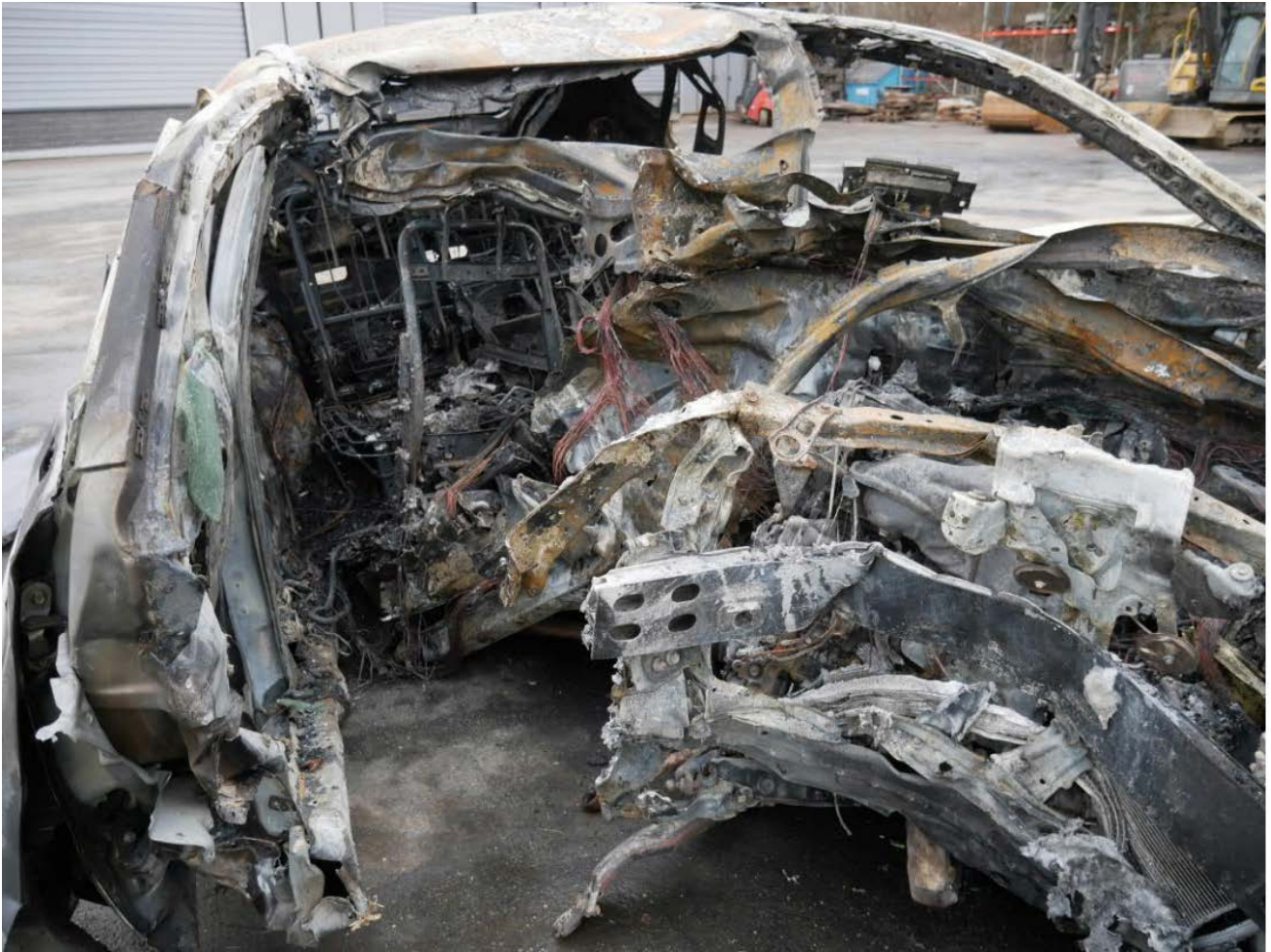
Bild 4. Främre tvärbalk intryckt ca 800 mm. Främre delen av taket tillbakatryckt ca 1200 mm.