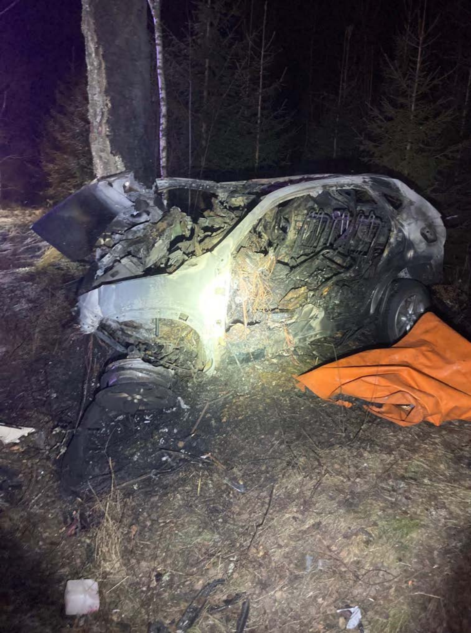
Bild 3. Efter att räddningstjänsten har klippt bort b-stolpe och bägge dörrarna.