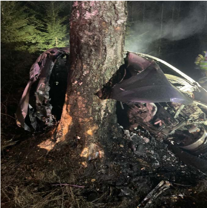
Bild 2. Trädet ca 54 cm i diameter