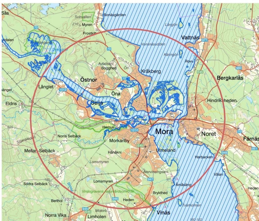
Karta över Mora med områden som ligger under vatten vid ett 100-årsflöde i blått/randigt.