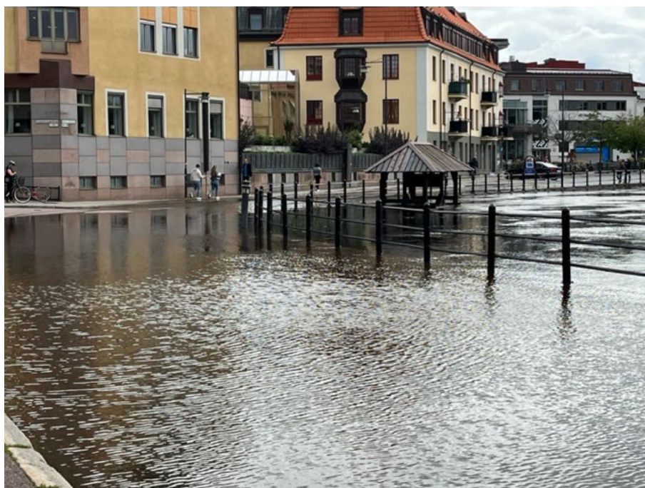
Östra Hamngatan i Falun hamnade under vatten på grund av höga nivåer i Faluån.