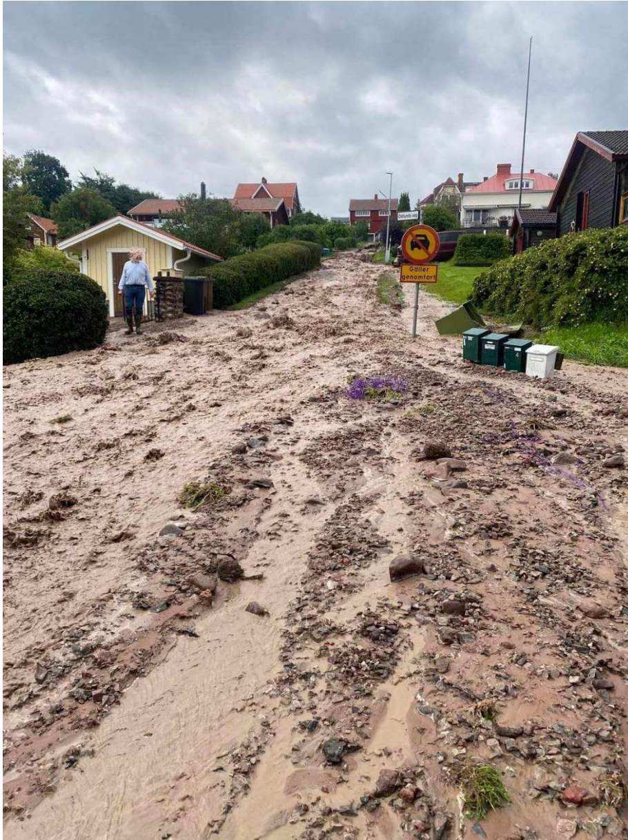
Östlunds väg i Lerdal spolades bort vid skyfallet.