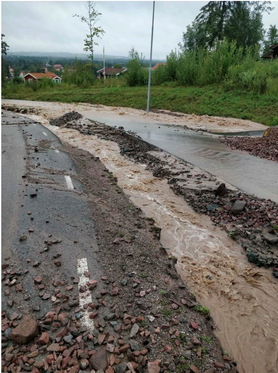
Vattenflöden på Slalomvägen i Lerdal efter skyfallet.