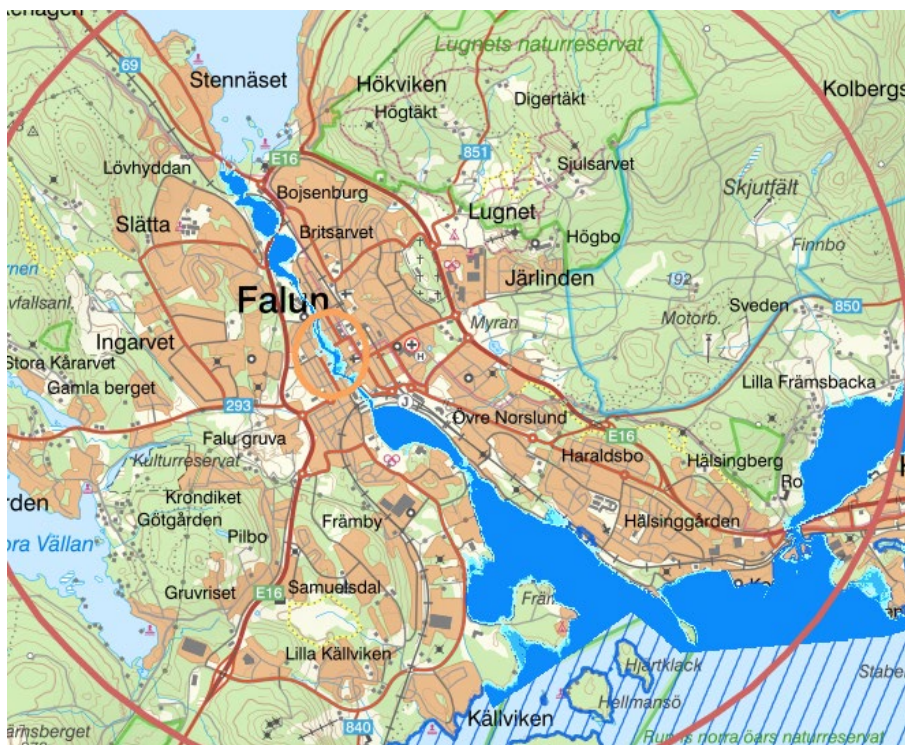
Karta över Falun med områden som ligger under vatten vid ett 100-årsflöde i blått/randigt samt mörkblått.