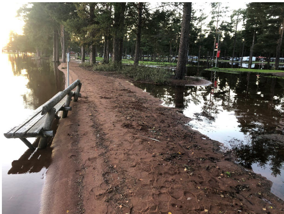
Delar av Orsa camping hamnade under vatten vid översvämningen.