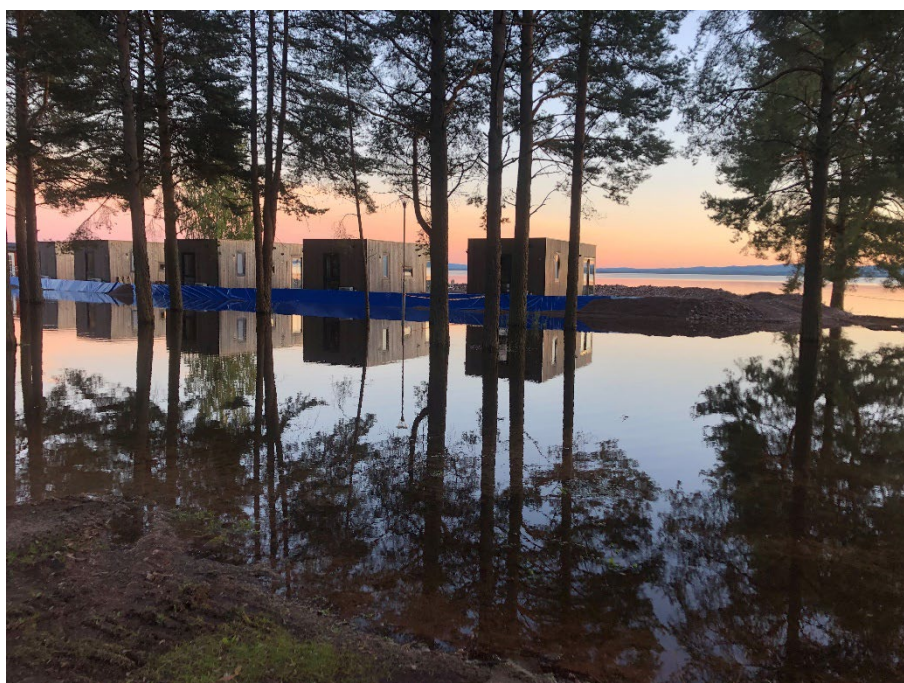
Skyddsbarriärer sattes upp vid Orsa camping för att förhindra skador på byggnader vid översvämningen.