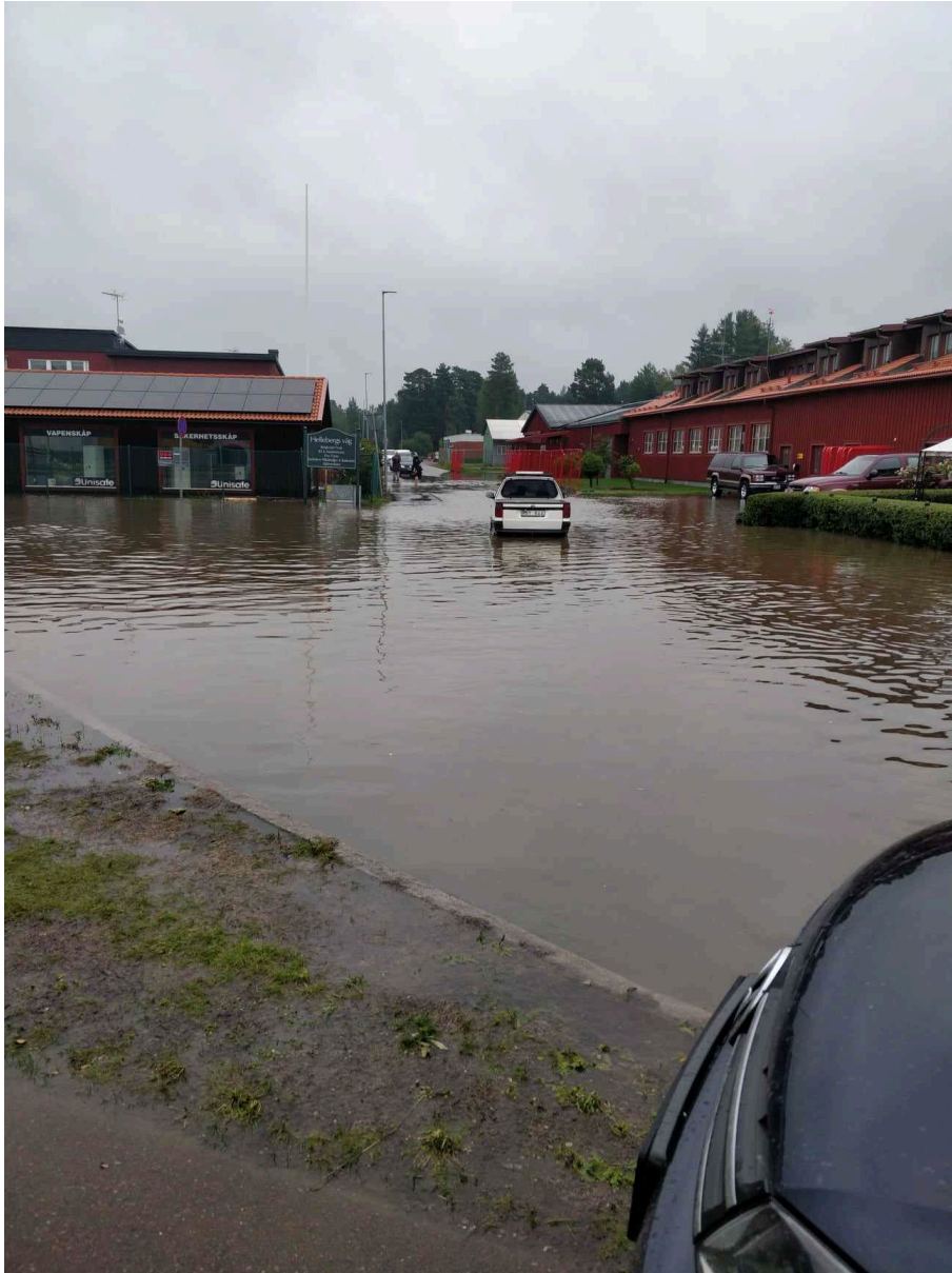
Översvämning vid Lilla industriområdet i Rättvik.