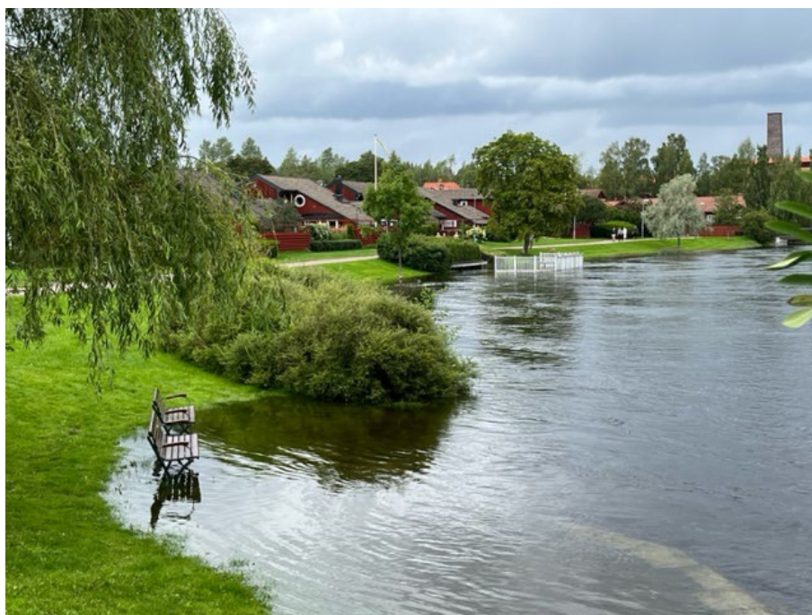
Höga nivåer i Faluån.