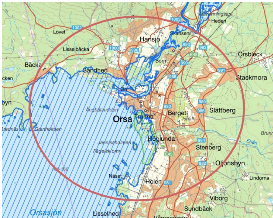
Karta över Orsa med områden som ligger under vatten vid ett 100-årsflöde i blått/randigt.