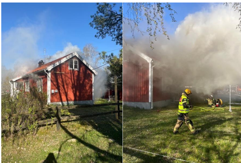
Bilder tagna 2023-05-10, kl 08:25 vy från östra gaveln och baksida.

Brandgaserna är för varma och branden tilltar när vi gör första försöket att ta oss in i byggnaden.