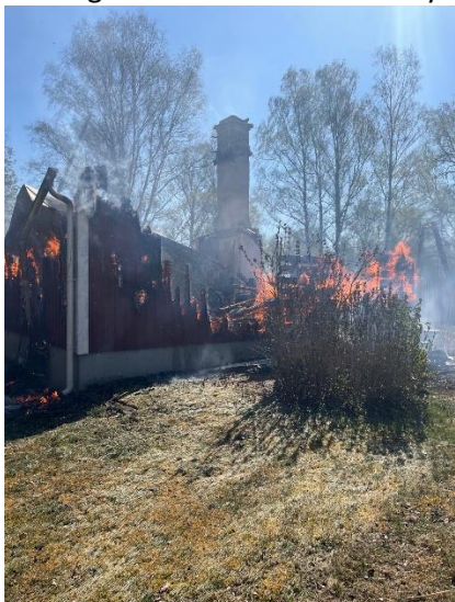
Bild tagen 2023-05-10 kl 10:24 vy baksida