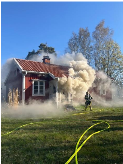
Bild tagen 2023-05-10 kl 08:33 Vy från framsida.

Vi avbryter försöket och kyler brandgaserna och försöker få ner temperaturen, för att göra ett nytt försök att komma in.