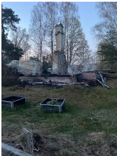
Bilden är tagen 2023-05-10 kl 21:27

Vid branden omkom [REDACTED] av sina skador. Trafikverkets och [REDACTED] personal tillsammans med personal från 7340 och ambulans lyckades få i gång hjärtat på [REDACTED] och lastade [REDACTED] i ambulansen. Han avled senare på sjukhus av sina skador. Huset är totalt skadat och nerbrunnet till grunden.