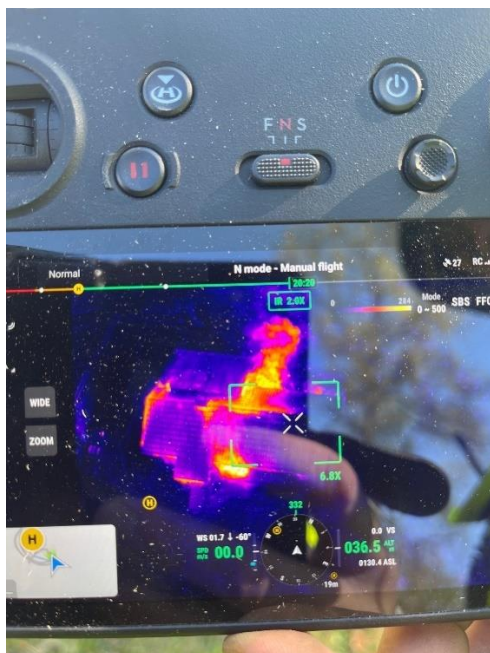
Bild tagen 2023-05-10 kl 08:43 med UAS och IR ovanifrån På bilden kan man se att sovrummet som ligger längst ner till höger på bilden (syd-östra delen av huset) där man också hittade [REDACTED], som räddades ut ur huset är minst brandpåverkat.