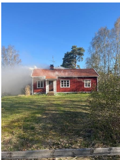
Bild tagen 2023-05-10, kl 08:24 vy från framsida.

Kl 08:16 7080 ger framkomstrapport och kl 08:21 ger 7080 en förstärkt framkomstrapport att påbörja rökdykning och kl 08:24 görs första försök med inträngning i byggnad.