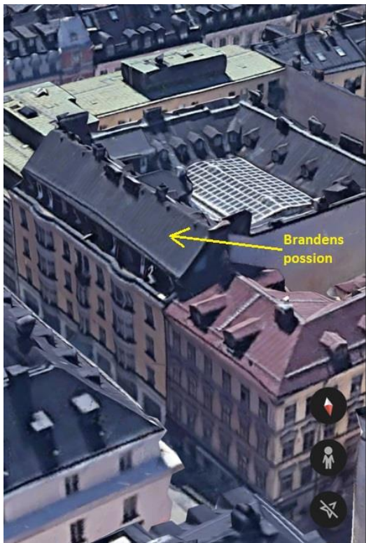
Figur 7. Översiktsbild från Google Earth