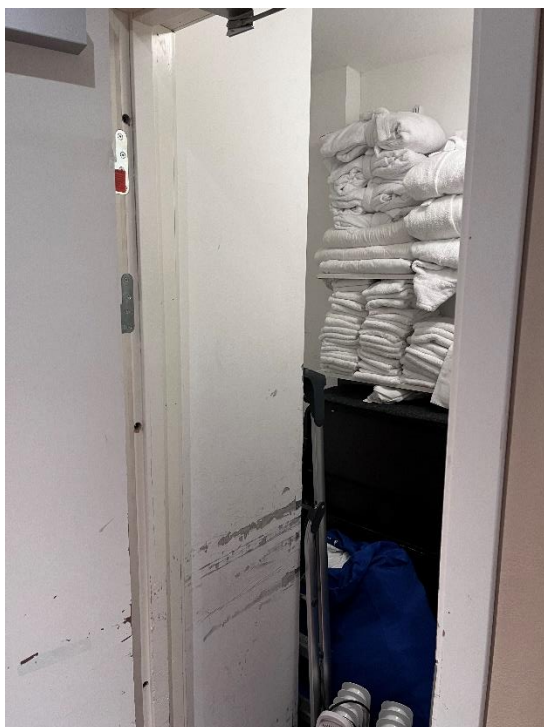
Figur 9. Linneförråd plan 4