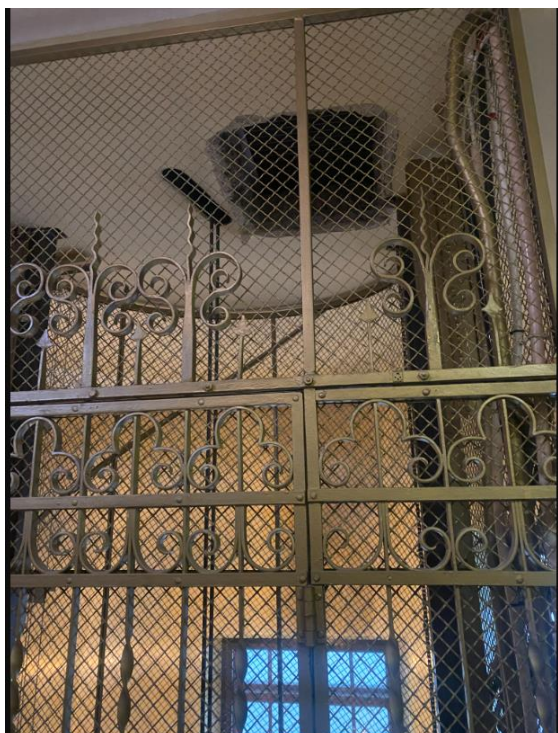
Figur 5. Rökevakuering i hissutrymmet