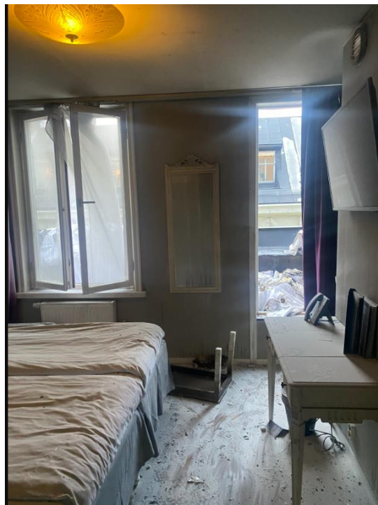
Figur 2. Hotellrum med öppen dörr