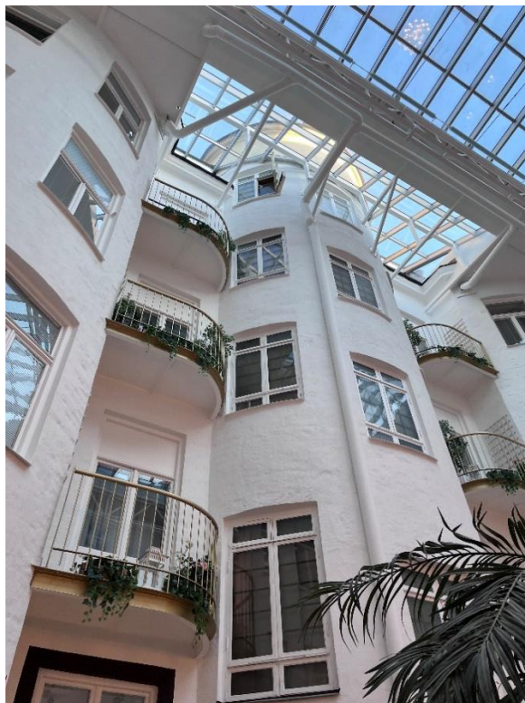
Figur 8. Trapphuset från innergården