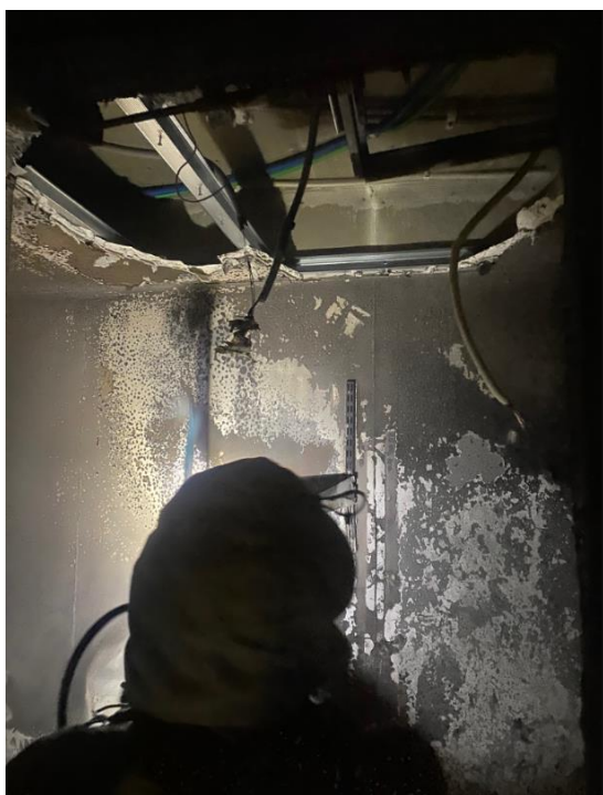
Figur 3. Linneförråd plan 5