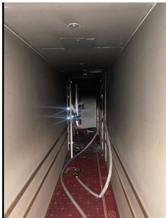
Figur 4. Hotellkorridor plan 5

Branden släcks av rökdykarna och man påbörjar ventilering av brandröken samt lämpning av brandskadat material. Samtliga trapphusdörrar i hotellkorridoren bibehöll sin rökavskiljande förmåga förutom den dörren som användes som angreppsväg.