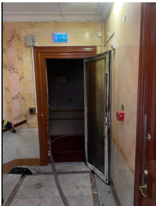
Figur 1. Uppbruten trapphusdörr plan 5